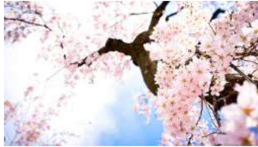
Gambar 8. Bunga Sakura