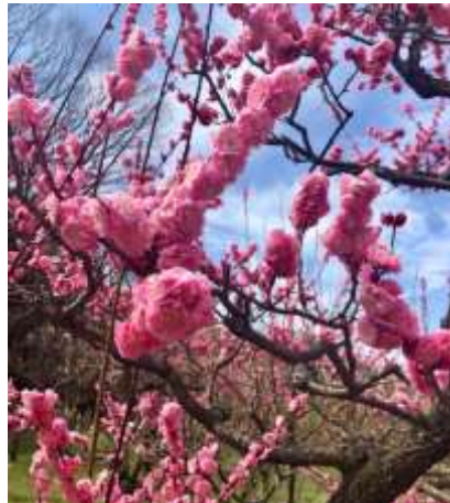
Gambar 3. Bunga Meihua