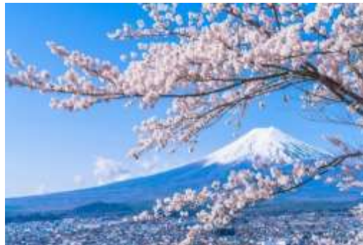
Gambar 6. Bunga Sakura