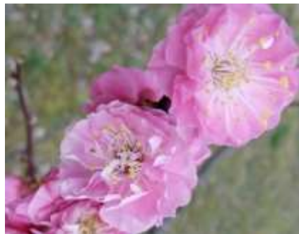
Gambar 4. Bunga Meihua