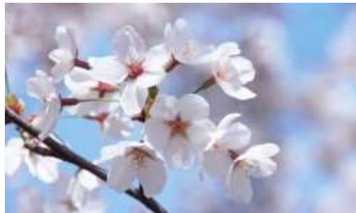
Gambar 7. Bunga Sakura