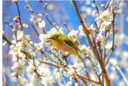
Gambar 9. Bunga Sakura