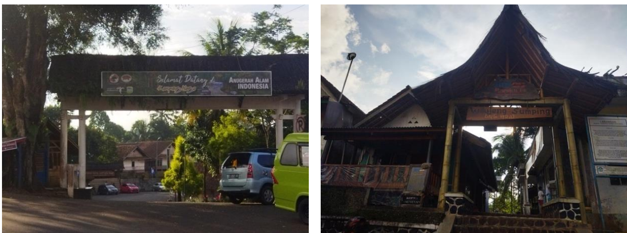
Gambar 2. Gerbang Luar dan Gerbang Dalam Kampung Naga

Jarak kampung naga dari Ibukota Kabupaten Tasikmalaya yaitu Singaparna adalah 16 kilometer, berkendara ke arah barat dari Singaparna dengan waktu tempuh selama 28 menit menggunakan kendaraan bermotor. Lokasi Kampung Naga sendiri berada di tepi jalan nasional yang menghubungkan Kabupaten Tasikmalaya dan Kabupaten Garut gambar 1 .