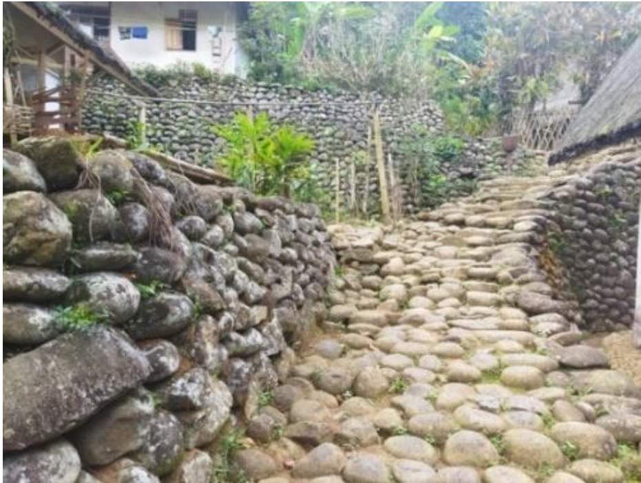
Gambar 3. Batu Penahan Erosi ( Batu Entep )

teras-teras, serta dengan cara melindungi lereng dengan tutupan batuan “ di batu entep ”. Batu yang didapatkan dari sungai di sebelah kampung dibawa ke kampung sebagai bahan untuk menutupi lereng, hal tersebut bertujuan untuk menahan gerakan tanah dan mengurangi erosi percik yang dihasilkan dari air hujan.