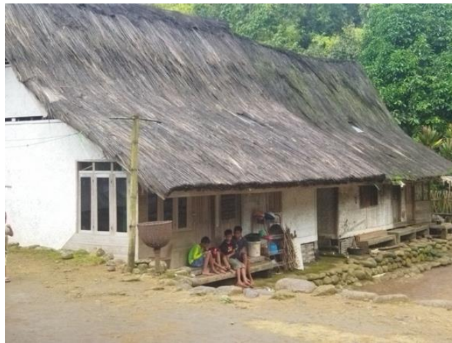
Gambar 3. Rumah Kampung Naga

Bentuk rumah masyarakat Kampung Naga yang merupakan rumah tradisional Masyarakat Sunda pada umumnya masih menggunakan batu tumpuan di bawah, dan di atasnya menggunakan struktur kayu dan bambu, serta atapnya masih menggunakan ijuk. Struktur rumah demikian sangat ramah terhadap bencana gempa bumi, salah satunya adalah karena strukturnya ringan, kemudian pengikat antar kayu sangat kuat dan tidak menggunakan paku besi. Masyarakat menyikapi bencana gempa bumi sebagai sesuatu yang harus diterima dan disikapi dengan baik (Ayub et al., 2021). Hal tersebut tercermin dari bentuk bangunan rumah mereka.