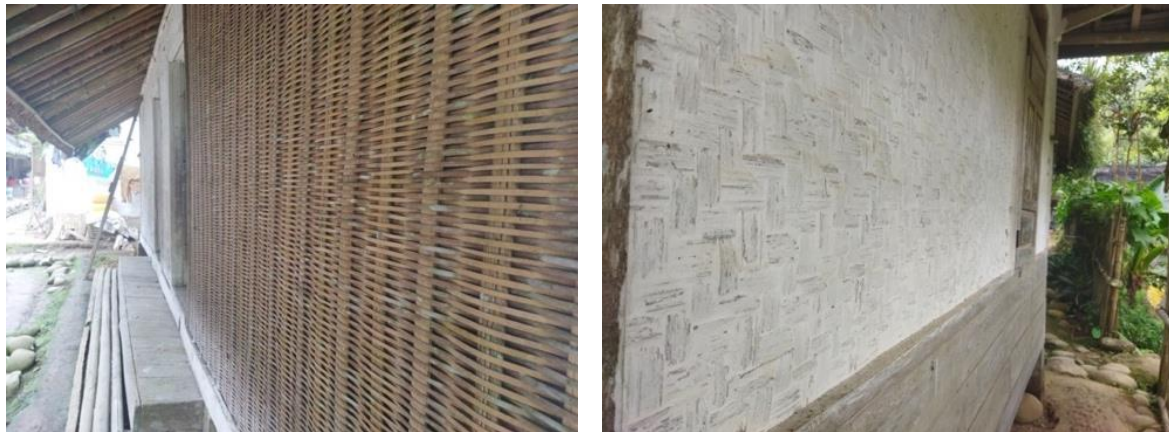
Gambar 5. Anyaman Dinding Dapur ( Bilik Sasag ) dan Anyaman Dinding ( Bilik Keping ) Biasa

Struktur rumah yang dipakai di Kampung Naga masih tradisional dengan menggunakan banyak kayu dan bambu. Penggunaan media bambu dalam membuat rumah merupakan pendekatan yang efektif dalam mitigasi bencana (Maryani & Yani, 2015). Satu sisi kondisi tersebut sangat adaptif terhadap gempa bumi, di sisi lain justru melipat-gandakan resiko untuk bencana yang lain, yaitu kebakaran. Struktur rumah tersebut sangat rentan terbakar, dan beresiko membahayakan masyarakat yang tinggal di rumah tersebut. Masyarakat kampung naga mengantisipasi bencana kebakaran dengan membuat pola anyaman yang sedikit berbeda untuk ruangan dapur. Desain untuk ruangan dapur dibedakan dengan ruangan lain, yaitu memakai anyaman “ bilik sasag ”, dengan fungsi ketika ada api di dalam dapur maka terlihat dari luar rumah. Selain fungsi tersebut, juga untuk cepat mengeluarkan asap ketika proses memasak di dapur. Kearifan lokal dapat mengurangi tingkat kepanikan warga saat terjadi bencana (Resha & Ernawati, 2019). Sedangkan untuk ruangan lain menggunakan anyaman “ bilik keping ” biasa. Adaptasi kearifan lokal dengan membuat anyaman bambu dengan jenis berbeda-beda tersebut tentunya sebagai cermin cara masyarakat dalam menjaga lingkungannya dari bencana kebakaran. Adat dan tradisi masyarakat tradisional selalu menjaga lingkungan tempat tinggalnya (Nurhuda & Saraswati, 2015).