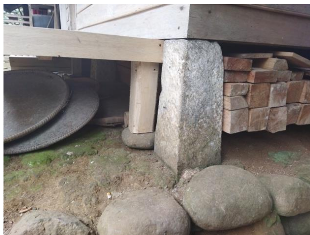
Gambar 4. Batu Tumpuan Rumah ( Batu Tatapakan )

Pada struktur bangunan rumah adat Kampung Naga terdapat batu tumpuan ( Batu Tatapakan ). Bangunan rumah dibuat atas tiang-tiang yang diletakkan diatas batu umpak (Permana et al., 2011). Posisi batu tumpuan di bawah rumah yang posisinya fleksibel tanpa perekat dengan bangunan utama sangat membantu sebagai peredam getaran gempa. Kondisi rumah dengan struktur tersebut ketika terjadi gempa sangat kuat menahan getaran dan tidak terlalu beresiko ambruk atau hancur. Hal tersebut sangat penting untuk menjaga setiap masyarakat yang bertempat tinggal di rumah tersebut agar tidak tertimpa bangunan rumah.