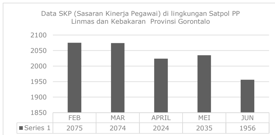
Grafik 1 Data SKP (Sasaran Kinerja Pegawai) di lingkungan Satpol PP Provinsi Gorontalo Sumber Data: Dinas Satpol PP Linmas dan Kebakaran Provinsi Gorontalo Periode Feb-Jun 2024

Stres kerja juga menjadi faktor signifikan yang memengaruhi penilaian kinerja. Stres muncul ketika tuntutan pekerjaan melebihi kemampuan individu, sehingga menciptakan ketegangan emosional maupun fisik. Hasibuan (2016) menjelaskan bahwa stres kerja dapat memengaruhi emosi, proses berpikir, dan kondisi fisik pegawai sehingga berdampak langsung pada produktivitasnya. Pada Satpol PP Provinsi Gorontalo, tekanan pekerjaan yang tinggi, risiko di lapangan, serta tuntutan penyelesaian tugas dalam waktu singkat menjadi penyebab utama meningkatnya stres kerja.