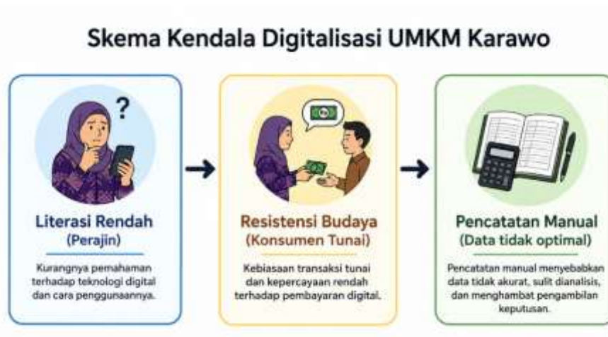
Gambar 1 Skema Kendala Digitalisasi UMKM Karawo

Meskipun potensi pertumbuhan sangat besar, Galeri Olaku masih menghadapi hambatan dalam optimalisasi digitalisasi. Permasalahan utama meliputi rendahnya literasi digital di tingkat perajin dan adanya resistensi budaya dari konsumen yang masih enggan beralih dari transaksi tunai. Selain itu, manajemen pencatatan keuangan seringkali belum terintegrasi secara otomatis secara maksimal dengan sistem QRIS, sehingga data transaksi belum sepenuhnya dimanfaatkan untuk pengambilan keputusan strategis. Hambatan ini diperparah dengan fluktuasi penggunaan digital yang dipengaruhi oleh kebiasaan konsumen lokal di sektor kerajinan tangan spesifik seperti Karawo.