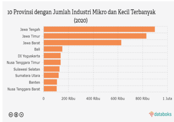
Gambar 1. 1 Data jumlah UMKM di 10 provinsi terbanyak