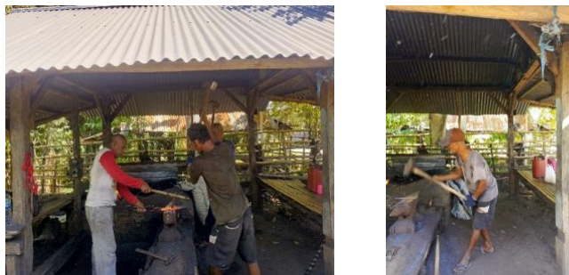
Gambar 2. Proses Penempa Besi Dengan Alat Tradisional

Berikut ini merupakan kegiatan proses penempa besi yang sedang dilakukan di UKM panre besi yang masih menggunakan alat tradisional yang dapat dilihat pada sebagai berikut: