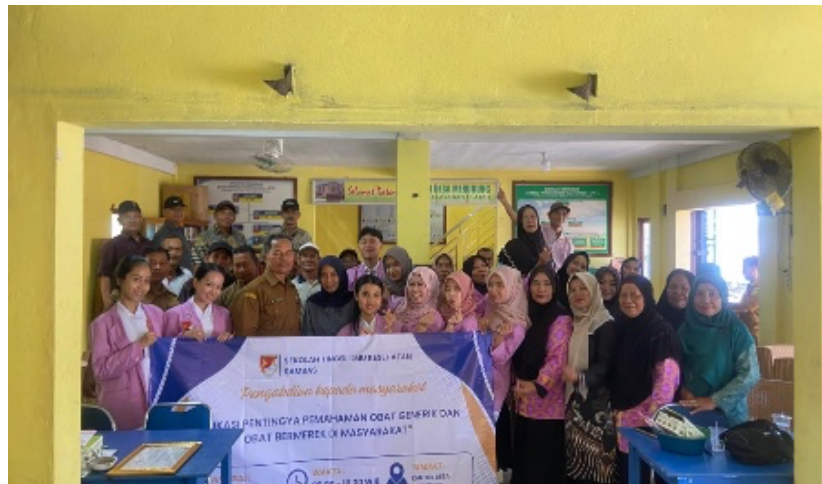
Gambar 3. Dokumentasi bersama masyarakat

langsung perbedaan obat generik dan bermerek, menjelaskan cara melihat tanggal Expired date pada obat dan cara penyimpanan obat yang baik dan benar. Berakhirlah kegiatan ini dengan dilakukan Post-test untuk menilai peningkatan pemahaman peserta terhadap materi yang telah disampaikan. Sebagai bentuk penghargaan, tim pelaksanaan PKM juga memberikan cenderamata kepada pihak Kantor Desa Merubung Kec. Tekarang Perbatasan Indonesia-Malaysia yang telah mendukung kegiatan PKM ini. Kegiatan diakhiri dengan sesi foto bersama sebagai dokumentasi dan penutup kegiatan PKM.