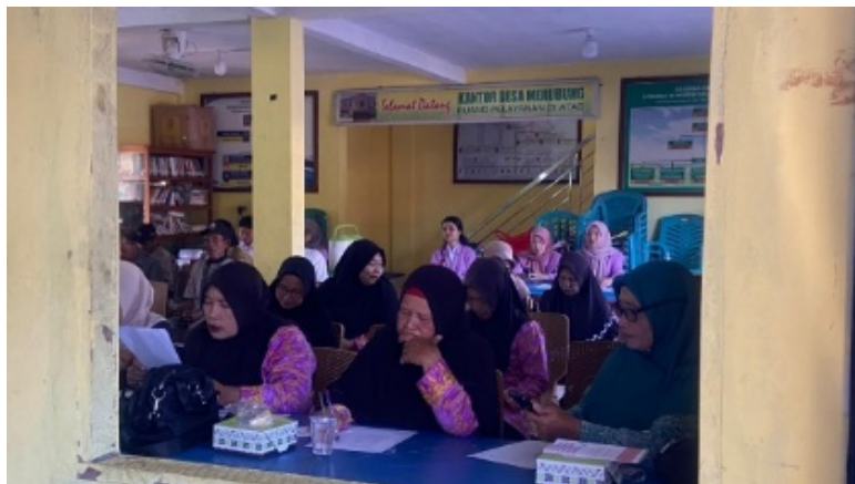
Gambar 1. Kegiatan Pre-test

Kegiatan pengabdian kepada Masyarakat (PKM) ini dilaksanakan dalam bentuk memberikan edukasi Kesehatan yang target utamanya Masyarakat Desa Merubung Kec. Tekarang Perbatasan Indonesia-Malaysia, dengan jumlah peserta sebanyak 40 orang. Kegiatan ini dilaksanakan pada hari Senin, 27 Oktober 2025, pukul 08.00 WIB hingga selesai, bertempat di Kantor Desa Merubung Kec. Tekarang Perbatasan Indonesia-Malaysia. Metode pelaksanaan kegiatan ini menggunakan metode visual dengan memaparkan materi menggunakan PowerPoint yang bersifat partisipatif dan interaktif. Tujuan utama dari kegiatan ini adalah menambah pengetahuan dan kesadaran masyarakat terhadap penggunaan obat generik atau obat bermerek.