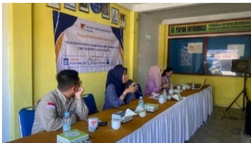
Gambar 2. Kegiatan sesi tanya jawab

Tahapan kegiatan dimulai dengan pelaksanaan Pre-test untuk mengukur Tingkat pemahaman awal peserta terhadap topik yang akan disampaikan. Selanjutnya, pemateri menyampaikan materi tentang pengertian obat, jenis obat, contoh obat, persamaan obat, perbedaan obat, dan manfaat menggunakan obat generik. Materi disampaikan menggunakan media visual dan Bahasa yang mudah dimengerti oleh masyarakat. Setiap kegiatan ini dipandu oleh moderator dan didokumentasikan oleh tim yang lain.