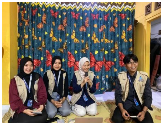
Gambar 2. Penyampaian Edukasi Leptospirosis oleh Tim KKN-T

Leaflet edukasi yang digunakan sebagai media penyuluhan kepada masyarakat. Leaflet memuat informasi mengenai pengertian leptospirosis, penyebab, cara penularan, gejala, serta langkah pencegahan penyakit. Penggunaan leaflet bertujuan mempermudah penyampaian informasi kesehatan secara ringkas, jelas, dan dapat dibaca kembali oleh peserta setelah kegiatan penyuluhan.