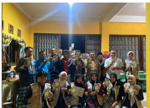
Gambar 3. Foto Bersama Tim KKN-T dan Masyarakat Dusun Tempel

Dokumentasi kegiatan berupa foto bersama antara tim KKN-T dan masyarakat setelah kegiatan penyuluhan selesai dilaksanakan. Dokumentasi ini menunjukkan partisipasi aktif masyarakat dalam mengikuti kegiatan edukasi kesehatan di Dusun Tempel.