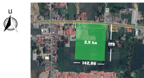
Gambar 1. Lokasi Site

Gorontalo, dengan luas lahan \pm 2,5 hektar. Pemilihan lokasi ini merupakan langkah strategis untuk mengatasi masalah aksesibilitas dan jaringan bisnis wirausaha. Posisi site mendukung penerapan prinsip quadruple helix (kolaborasi akademisi, pelaku bisnis, pemerintah, dan masyarakat) dalam menciptakan ekosistem inkubasi bisnis yang optimal di Provinsi Gorontalo.