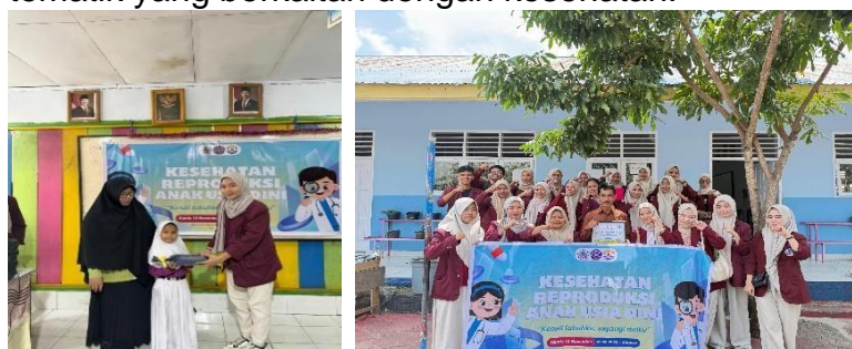
Gambar 8. Pemberian Hadiah dan Foto Bersama Kepala Sekolah SDN 80 Kota Tengah

Melalui permainan ini, siswa dapat menunjukkan pemahaman mereka secara interaktif dan berkompetisi dalam suasana positif. Selain itu, sesi permainan juga memperkuat kerja sama tim dan komunikasi antara siswa. Setelah permainan selesai, sebagai bentuk apresiasi terhadap partisipasi dan usaha mereka, setiap kelompok yang berhasil menjawab dengan benar akan menerima hadiah. Hadiah ini dapat berupa alat tulis, buku cerita, atau merchandise tematik yang berkaitan dengan kesehatan.