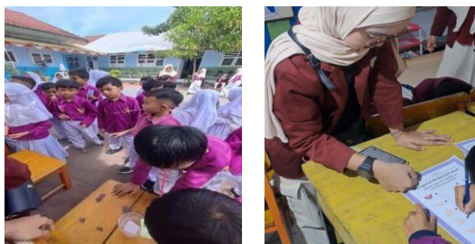
Gambar 7. Evaluasi dan Games

menerapkan pemahaman tersebut dalam kehidupan sehari-hari.