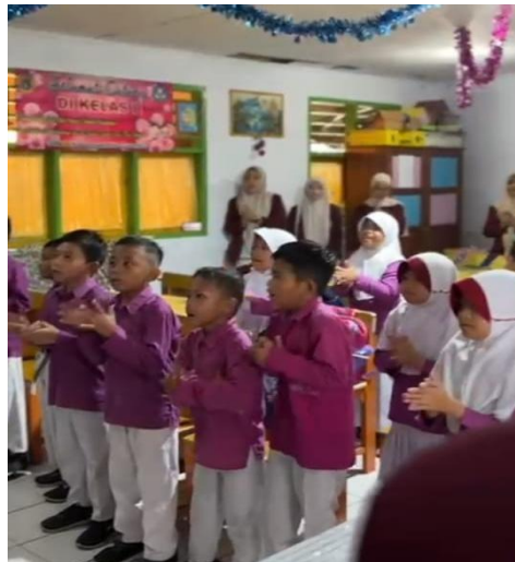
Gambar 5. Ice Breaking Bersama Murid SDN 80 Kota Tengah

(hygiene) dan kebersihan lingkungan (sanitasi) serta pencegahan kekerasan seksual pada anak sejak dini 7 . Program peningkatan Kesehatan Reproduksi (Kespro) saat ini menjadi fokus perhatian pemerintah dan masyarakat Indonesia, sebab dampak rendahnya pemahaman masyarakat mengenai kesehatan reproduksi menyebabkan timbulnya berbagai masalah kesehatan, ekonomi, sosial serta kriminalitas semakin yang terjadi merajalela diseluruh wilayah tanah air. Memotivasi anak untuk dapat menjaga kebersihan diri dengan mengajari dan melatih keterampilan anak untuk belajar mencuci tangan dan menyikat gigi yang benar, menjaga kebersihan tubuh seperti mandi dan keramas, rutin menggunting dan membersihkan kuku tangan dan kaki, menggunakan alas kaki saat diluar rumah, menggunakan air bersih untuk MCK dan tidak bermain di air kotor serta tidak buang air besar dan buang air kecil (BAB dan BAK) sembarangan, membuang sampah pada tempatnya, serta pencegahan kekerasan/ kejahatan seksual pada anak sejak dini.