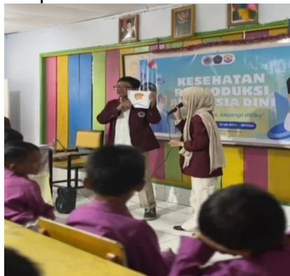
Gambar 6. Pemberian materi edukasi tentang Kesehatan Reproduksi Usia Dini.

lebih mendalam tentang kesehatan reproduksi, termasuk pengenalan terhadap bagian-bagian tubuh, perbedaan gender, serta pentingnya menjaga kebersihan dan kesehatan diri. Materi ini disampaikan dengan cara yang sesuai dengan perkembangan usia anak, menggunakan visual dan contoh yang relevan agar mudah dipahami. Dengan demikian, siswa tidak hanya sekedar menerima, tetapi juga mampu menginternalisasi pengetahuan tersebut, menjadikan mereka lebih sadar akan informasi kesehatan tubuh mereka dan lebih mampu menghormati tubuh orang lain. Kegiatan ini diharapkan dapat memberikan dampak positif bagi siswa dalam memahami kesehatan reproduksi dan menerapkannya dalam kehidupan sehari-hari.