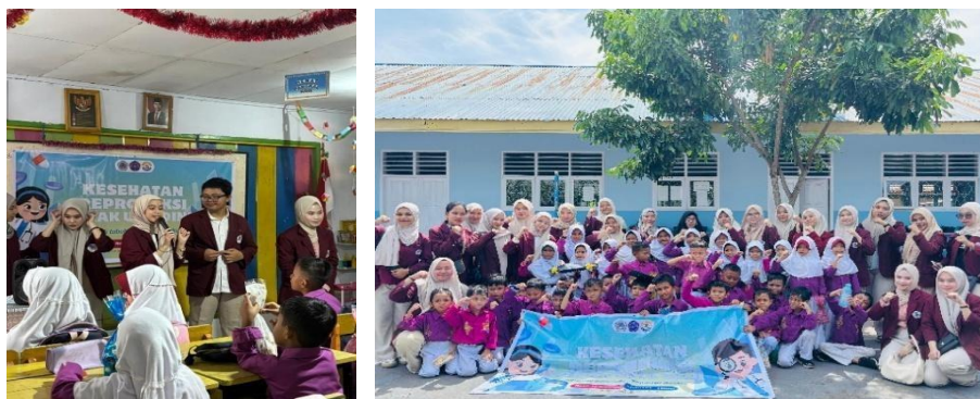
Gambar 2. Pelaksanaan Kegiatan Bersama Murid SDN 80 Kota Tengah

Melaksanakan kegiatan pengabdian masyarakat ini diawali dengan perencanaan yang matang untuk memastikan materi yang disampaikan relevan dan sesuai dengan kebutuhan siswa. Tahap pertama adalah penyuluhan interaktif yang bertujuan untuk memberikan pemahaman yang mendalam mengenai konsep mengenal tubuh pada anak usia dini.