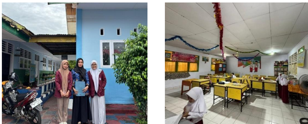
Gambar 1. Persiapan dan Pengurusan Izin Pelaksanaan

Persiapan dilakukan dengan membuat surat izin kepada kepala sekolah dan guru SDN 80 Kota Tengah yang selanjutnya dilakukan observasi oleh pihak mahasiswa kesehatan masyarakat UNG dan setelah mendapat persyaratan tersebut mahasiswa Kesehatan Masyarakat mendatangi sekolah untuk melakukan intervensi yang telah disepakai bersama. Persiapan materi kami membuat lembar balik dan modul serta dilanjutkan dengan kuis tentang pengenalan anggota tubuh pada setiap siswa.