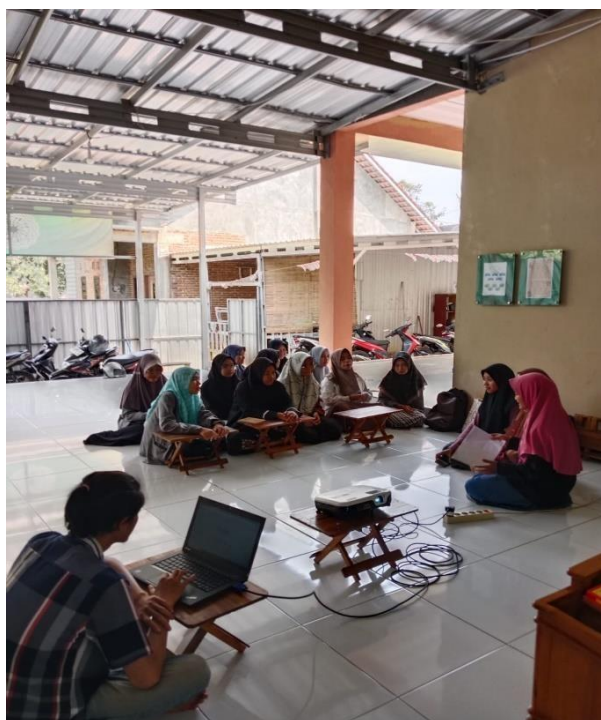
Gambar 1. Proses Penyampaian Materi

Pelatihan tersebut diadakan pada hari Sabtu, 23 september 2023, dari pukul 13:00 hingga 15.00 di aula utama Griya Santri Mahabbah. Terdapat 15 mahasantri dan 5 anggota tim pelatih, dengan salah satu tim pelatih berfungsi sebagai penyaji materi atau narasumber.