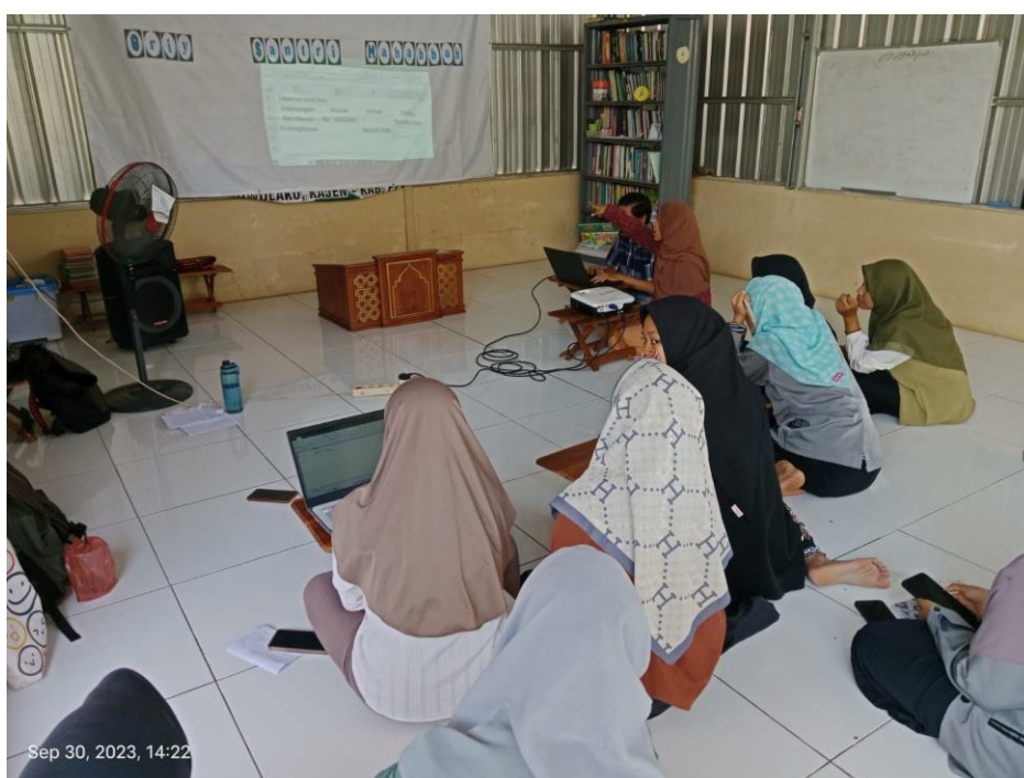
Gambar 2. Proses Sesi Tanya Jawab Peserta Pelatih

cara penggunaan Ms. Excel yang disimak dengan seksama oleh rekan-rekan Mahasanti Griya Santri Mahabbah. Kemudian dilanjutkan materi kedua mengenai bagaimana membuat jurnal kas masuk dan kas keluar dalam Ms. Excel. Penyampaian materi ini bertujuan untuk memberikan pemahaman tentang penggunaan Ms. Excel sebelum praktik pembuatan laporan keuangan dengan Ms. Excel serta memberikan gambaran yang lebih jelas tentang cara membuat laporan keuangan yang disusun secara sistematis dan tentunya sesuai dengan peraturan yang berlaku. Penyampaian materi ini disampaikan selama 1 jam. Penyajian materi juga diselingi dengan hiburan dan candaan agar tidak terkesan tegang dan menyramkan.