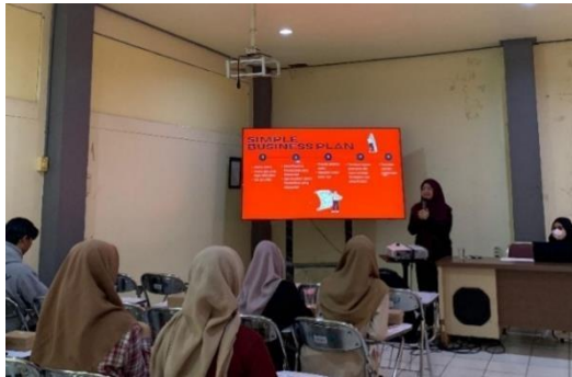
Gambar 1. Sesi pemaparan materi