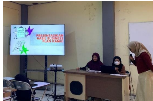
Gambar 2. Presentasi Business Plan oleh peserta

Sebagai bentuk pengukuran dampak kegiatan, tim pelaksana melakukan evaluasi melalui penyebaran instrumen kuesioner secara daring menggunakan Google Form . Kuesioner ini dirancang menggunakan skala Likert empat poin untuk memberikan penilaian atas beberapa aspek substantif dan teknis dari kegiatan. Selain bagian tertutup, kuesioner juga memuat isian esai terbuka untuk memberikan ruang refleksi bagi peserta. Adapun empat indikator yang diukur dalam kuesioner adalah: