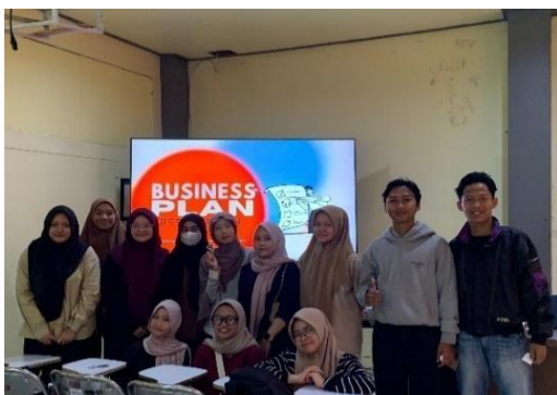
Gambar 4. Foto bersama peserta sosialisasi

Secara keseluruhan, hasil evaluasi menunjukkan bahwa kegiatan ini telah terlaksana dengan baik dan sesuai dengan tujuan yang dirancang. Respons positif peserta tidak hanya mencerminkan keberhasilan dari segi pelaksanaan, tetapi juga mengindikasikan bahwa program ini mampu membangun motivasi dan kesiapan mahasiswa untuk terlibat dalam dunia usaha secara lebih terstruktur. Evaluasi ini menjadi dasar penting bagi pengembangan program sejenis di masa depan, baik dari segi materi, metode, maupun perluasan jangkauan pelaksanaan.