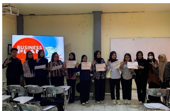
Gambar 5. Foto bersama peserta sosialisasi