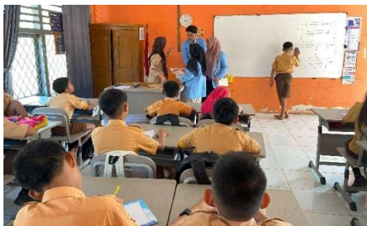
Gambar 5. Sosialisasi Pencegahan Stunting Di SDN 11 Tanjung Raja