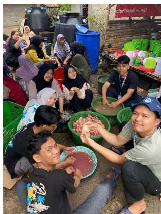
Gambar 13. Membantu warga menyiapkan acara aqiqah anak salah satu warga desa