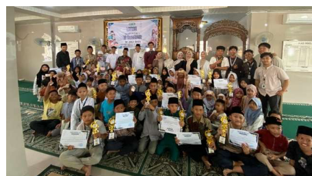
Gambar 10. Para pemenang lomba islami 10 muharam

Pada momentum peringatan 10 Muharam, mahasiswa KKN ke-83 Kelompok 51 UIN Raden Fatah Palembang turut berperan aktif dalam pelaksanaan kegiatan perlombaan islami yang ditujukan bagi anak-anak di Desa Tanjung Agas. Kegiatan ini mencakup lomba mewarnai gambar bertema kartun islami, lomba azan, serta lomba membaca Al-Qur'an. Tujuan dari kegiatan ini adalah untuk menumbuhkan semangat keagamaan sejak dini melalui pendekatan yang menyenangkan dan sesuai usia, sehingga anak-anak dapat belajar sambil berkreasi dan berkompetisi secara sehat. Mahasiswa bersama masyarakat dan pihak terkait saling bekerja sama dalam merancang konsep, mempersiapkan perlengkapan, serta memastikan jalannya perlombaan berlangsung lancar. Suasana acara diwarnai antusiasme anak-anak yang dengan penuh percaya diri mengikuti setiap lomba, serta dukungan hangat dari para orang tua dan tokoh masyarakat setempat. Momen ini menjadi sarana yang tidak hanya menanamkan nilai-nilai religius, tetapi juga mempererat hubungan sosial antarwarga dan mahasiswa KKN. Melalui kegiatan perlombaan islami ini, diharapkan anak-anak semakin termotivasi untuk mendalami bacaan Al-Qur'an, mempelajari adab melantunkan azan, dan mengembangkan kreativitas seni yang bernuansa islami. Kehangatan dan kebersamaan yang tercipta dalam acara ini juga menjadi wujud nyata dari semangat gotong royong serta kepedulian terhadap pembinaan karakter generasi muda di desa.