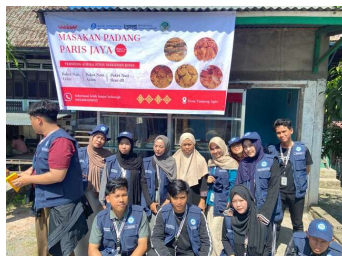
Gambar 2. Pemasangan Banner UMKM