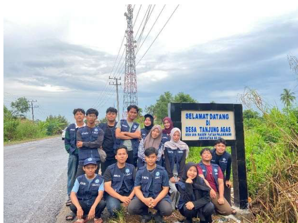
Gambar 15. Tugu hasil kolaborasi mahasiswa KKN dan warga desa Tanjung Agas

Salah satu program yang memiliki makna khusus dan berdampak jangka panjang adalah pembangunan tugu identitas desa. Ide pembangunan tugu muncul setelah diskusi dengan perangkat desa yang menginginkan adanya simbol khas yang bisa menjadi kebanggaan bersama dan penanda visual bagi Desa Tanjung Agas. Mahasiswa kemudian membantu mendesain konsep tugu yang sederhana namun sarat makna, serta menggalang dukungan dari warga desa, karang taruna, dan tokoh masyarakat. Proses pembangunan tugu melibatkan warga secara gotong royong, sehingga menjadi lebih dari sekadar proyek fisik. Tugu tersebut diharapkan menjadi simbol