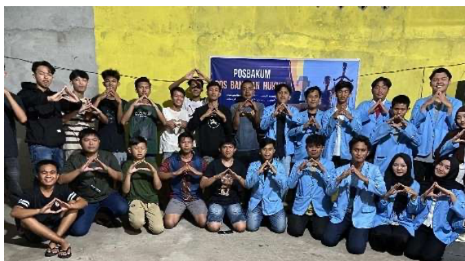
Gambar 4. Sosialisasi Pos Bantuan Hukum (POSBAKUM)

Tidak hanya terbatas pada konsultasi, POSBAKUM ini juga menjadi wadah pemberian informasi hukum yang lebih luas. Mahasiswa menjelaskan hak dan kewajiban warga sebagai bagian dari masyarakat hukum, serta memperkenalkan peraturan-peraturan dasar di tingkat desa dan pemerintah daerah. Harapannya, warga dapat lebih mengenali jalur resmi yang tersedia saat menghadapi permasalahan hukum, serta memahami pentingnya komunikasi dengan pihak berwenang secara baik dan benar.