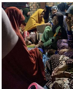
Gambar 12. Tahlilan bersama warga desa Tanjung Agas