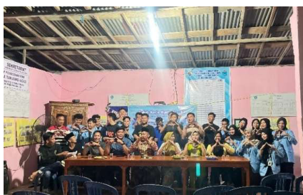
Gambar 1. Pertemuan awal dengan perangkat desa dan warga setempat sekaligus sosialisasi QRIS dan Perlindungan Konsumen

ini dilengkapi dengan edukasi tentang Perlindungan Konsumen yang menekankan hak dan kewajiban pelaku usaha serta pentingnya menjaga keamanan data pribadi. Dengan cara ini, pelaku UMKM tidak hanya memahami teknologi pembayaran digital, tetapi juga semakin sadar akan pentingnya berbisnis secara jujur, aman, dan bertanggung jawab.