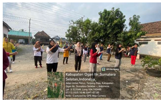
Gambar 6. Senam bersama Ibu-ibu desa Tanjung Agas

Dalam proses penyampaian materi, mahasiswa berusaha menggunakan bahasa yang sederhana dan dekat dengan keseharian anak-anak. Contohnya, mahasiswa memberikan contoh jenis makanan yang mudah ditemukan di rumah atau warung sekitar desa agar siswa merasa lebih akrab dan mudah mengingatnya. Mahasiswa juga mengingatkan pentingnya kebiasaan menjaga kebersihan diri, seperti mencuci tangan sebelum makan dan setelah bermain, serta menggosok gigi secara rutin. Kebiasaan-kebiasaan sederhana ini dijelaskan sebagai langkah konkret untuk mencegah penyakit yang dapat menghambat pertumbuhan.