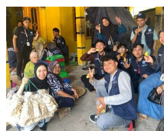
Gambar 3. Survei Banner sekaligus sosialisasi dan pendaftaran QRIS Merchant

Setelah tahap adaptasi awal bersama perangkat desa dan tokoh masyarakat, mahasiswa KKN ke-83 Kelompok 51 UIN Raden Fatah Palembang memulai salah satu program utama, yaitu pendampingan UMKM dalam pemanfaatan sistem pembayaran digital berbasis QRIS. Berdasarkan hasil pemetaan, ditemukan bahwa sebagian besar pelaku usaha di Desa Tanjung Agas masih mengandalkan transaksi tunai dan belum familiar dengan teknologi pembayaran non-tunai seperti QRIS. Melihat potensi dan kebutuhan tersebut, mahasiswa merancang sosialisasi yang memadukan penjelasan manfaat QRIS sekaligus pendampingan praktis agar pelaku UMKM dapat langsung mencoba dan memahaminya.