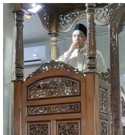
Gambar 9. Mahasiswa KKN menjadi Khatib