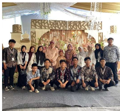
Gambar 14. Membantu warga serta menghadiri acara khitanan anak salah satu warga desa

Mahasiswa KKN Kelompok 51 ikut serta membantu pelaksanaan acara tahlilan yang diadakan oleh warga Desa Tanjung Agas. Dalam kegiatan ini, mahasiswa terlibat langsung mulai dari persiapan tempat, menata kursi, hingga membantu menyajikan konsumsi kepada para tamu. Selain membantu secara teknis, kehadiran mahasiswa juga membawa suasana lebih akrab dan hangat. Mahasiswa belajar menghormati tradisi lokal dan nilai spiritual di balik acara tahlilan, yang bukan hanya sekadar ritual, tetapi juga menjadi sarana memperkuat silaturahmi antarwarga. Kegiatan ini menjadi pengalaman penting bagi mahasiswa dalam memahami kehidupan sosial masyarakat desa yang kaya dengan nilai gotong royong.