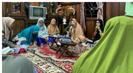
Gambar 8. Mahasiswi KKN mengikuti pengajian ibu-ibu