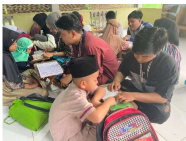
Gambar 7. Mengajar ngaji di TPA