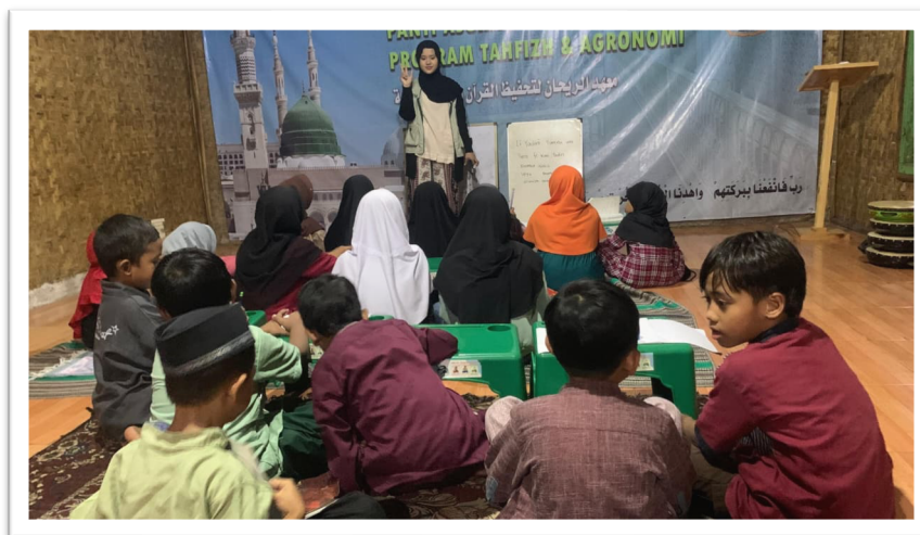
Gambar 2. Penjelasan makna kosakata oleh fasilitator

terlebih dahulu mengulang kembali lagu pada tema sebelumnya guna memperkuat retensi memori peserta terhadap kosakata yang telah dipelajari.