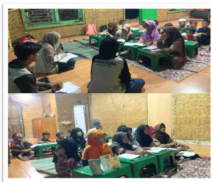
Gambar 1. Program Baitul Ahabab di Yayasan Ar-Raihan

Berdasarkan hasil koordinasi dan diskusi awal dengan pihak Yayasan Ar-Raihan Insani Depok, diketahui bahwa di sana belum terdapat program khusus pembelajaran bahasa Arab dasar bagi peserta didik. Informasi tersebut diperoleh melalui wawancara dengan Kepala Yayasan sebagai bagian dari proses identifikasi sebelum pelaksanaan kegiatan pengabdian. Hasil diskusi tersebut menunjukkan adanya kebutuhan akan program pembelajaran bahasa Arab yang sesuai dengan karakteristik anak-anak di yayasan. Oleh karena itu, disepakati bersama untuk menyelenggarakan kelas pembelajaran bahasa Arab dasar yang kemudian diberi nama " Baitul Ahabab " sebagai salah satu program pendidikan dari kegiatan KKN Kelompok Nawasena.