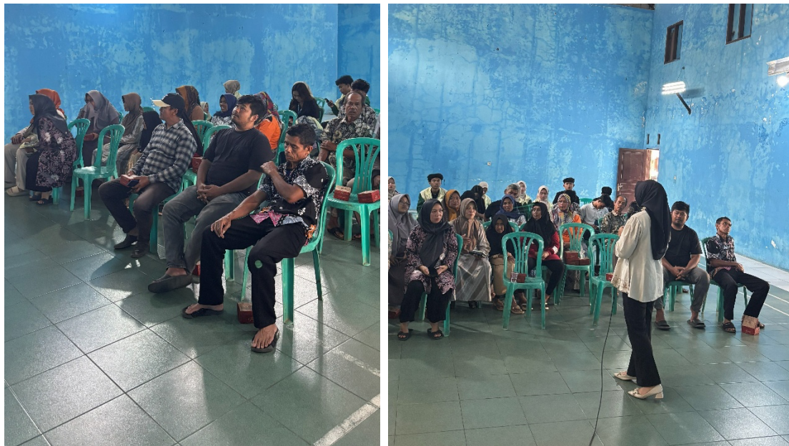
Gambar 2. Kegiatan sosialisasi dan pelatihan

Selanjutnya, dilakukan tahap pendampingan dan evaluasi secara berkala melalui kunjungan lapangan dan komunikasi daring. Pendampingan merupakan faktor penting dalam memastikan keberhasilan implementasi program karena dapat membantu peserta mengatasi kendala yang dihadapi secara langsung (World Bank, 2022). Evaluasi dilakukan menggunakan metode observasi, wawancara, dan kuesioner untuk mengukur peningkatan pengetahuan, keterampilan, dan perubahan perilaku peserta secara komprehensif.