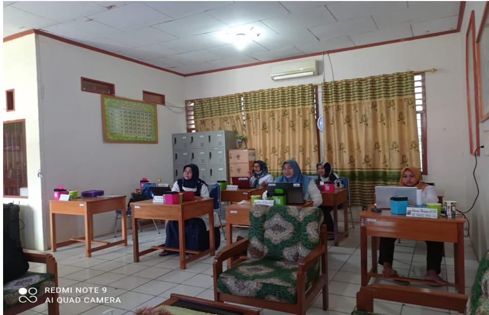
Gambar 1 Para Peserta Kegiatan

Adapun materi pertama kegiatan pelatihan yaitu penjelasan aplikasi Canva secara umum dan bagaimana membuat/registrasi akun Canva.