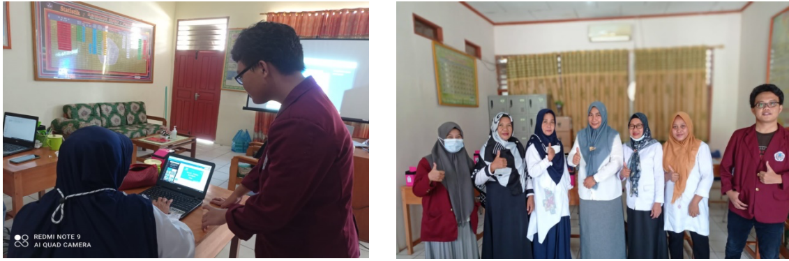
Gambar 3 Pelatihan Pembuatan Media Pembelajaran Berbasis Canva

Peserta dianggap mampu dalam mengikuti kegiatan pelatihan pembuatan media pembelajaran berbasis Canva ini, serta peserta sangat merasa tertarik dalam mengeksplor kreativitasnya.