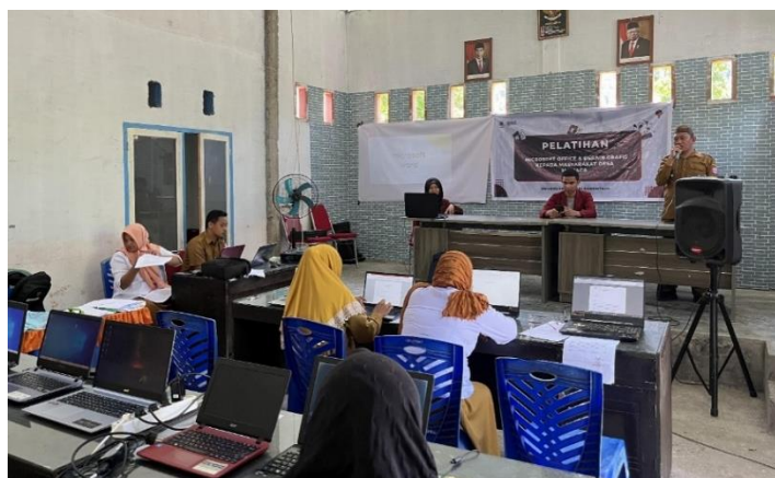
Gambar 2. Pembukaan Pelatihan Microsoft Office

Berdasarkan hasil pengamatan dan wawancara awal, dilakukan perancangan kurikulum pelatihan untuk disesuaikan dengan kebutuhan peserta pelatihan. Pada tahap ini juga dihasilkan materi pelatihan yang digunakan selama kegiatan pelatihan. Kegiatan pelatihan dilaksanakan pada bulan Oktober 2022, dengan pembukaan pelatihan yang dilaksanakan pada hari Rabu, 18 Oktober 2022 yang berlokasi di kantor Desa Masiaga.