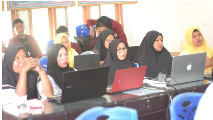
Gambar 3. Pelaksanaan Kegiatan Pelatihan

Selama pelaksanaan kegiatan terdapat beberapa penyesuaian waktu pelaksanaan dengan rencana yang ditetapkan sebelumnya. Hal ini disebabkan oleh pemahaman dan penguasaan materi oleh tiap aparat desa berbeda-beda. Akan tetapi penyesuaian tersebut tidak mengurangi substansi materi serta antusias peserta dalam mengikuti pelatihan yang dilaksanakan.