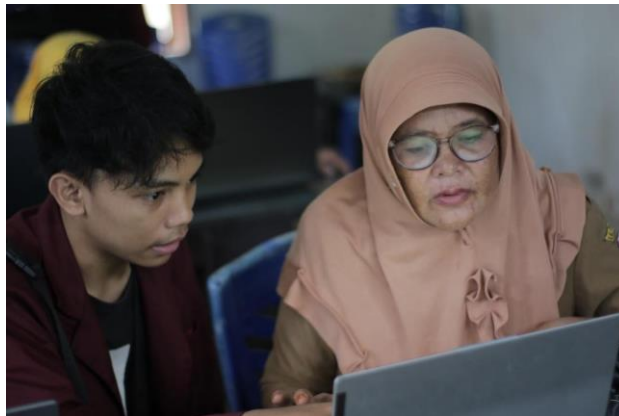
Gambar 1. Pengamatan untuk pendataan kebutuhan dan kemampuan awal aparat desa

Pendataan kebutuhan dan kemampuan awal aparat desa dilaksanakan dengan melakukan wawancara dan pengamatan secara langsung terkait pengetahuan dan keterampilan aparat desa dalam mengoperasikan aplikasi Microsoft Office . Pada tahapan awal ini, diketahui bahwa sebagian besar aparat desa belum sepenuhnya mengetahui seluruh fitur yang terdapat pada menu bar Microsoft Office . Fitur yang umumnya digunakan terbatas pada menu Home, Insert, dan Layout .