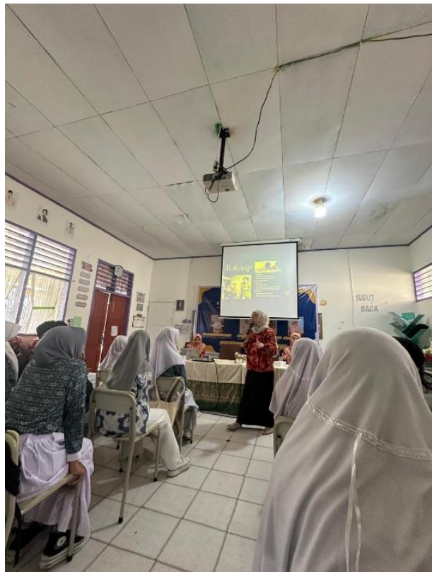
Gambar 1. Penyampaian materi bullying

Maka kegiatan sosialisasi ini bertujuan untuk menyadarkan peserta didik, meminimalisir pencegahan bullying, meningkatkan kesadaran akan bahayanya bullying. Bullying sangat rentan apalagi di jaman teknologi sekarang ini, dimana aktivitas online yang cukup tinggi yang mudah diakses oleh anak-anak sehingga meningkatkan resiko terjadinya pelecehan, komentar jahat, konten agresif, tren di media social seperti body shamming, roasting dan cancel culture bisa ditiru oleh anak tanpa memahami konsekuensinya. Dalam hal ini kami memberikan edukasi bersifat informasi kepada siswa SDN LAB UNG tentang bullying itu sendiri.