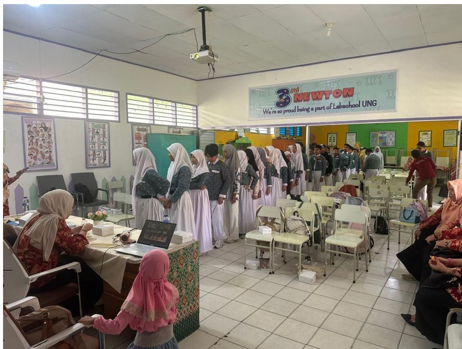
Gambar 2 Dokumentasi Games bersama tim dan Siwa SDN LAB UNG

Tim pengabdian memberikan materi sekaligus games sebagai media edukasi kepada siswa SDN LAB UNG untuk tidak melakukan perundungan terhadap teman sekelas maupun sebanyanya yang dapat membahayakan diri sendiri ataupun orang lain. Kegiatan games untuk membangun karakter siswa dalam bekerja sama, kekompakkan kelompok, saling menghargai maupun menghormati.