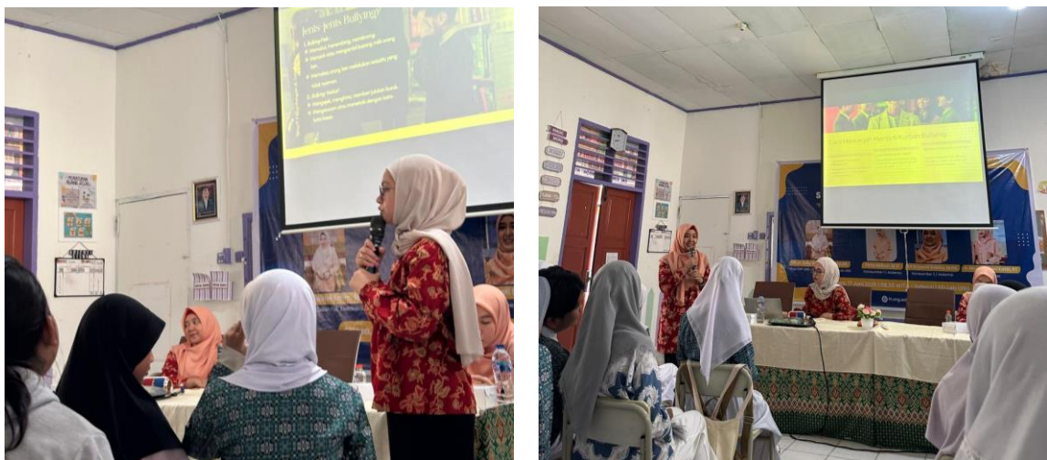
Gambar 2 : Penyampaian materi jenis-jenis bullying dan cara mencegah bullying

Dampak yang paling mudah dikenali untuk usia anak-anak adalah dampak jangka pendek, korban atau pelaku bullying baik anak-anak maupun orang dewasa akan mengalami beberapa hal yakni akibat dari perilaku bullying yang dilakukan oleh orang-orang sekitar yaitu masalah psikologis, seperti gangguan kecemasan sampai mengakibatkan depresi. Masalah psikologis yang dialami oleh anak-anak seperti sedih, kesepian, ketakutan maupun perubahan pola tidur dan pola makan sampai hilangnya minat untuk bersekolah. Masalah fisik, seperti anak mengalami memar, luka sampai terganggunya pencernaan akibat kecemasan yang dialami oleh korban bullying. Gangguan prestasi yang dialami oleh siswa karena korban bullying dalam kegiatan pembelajaran yang diadakan oleh sekolah, dan cenderung kesulitan berkonsentrasi dalam kelas, sering mengalami bolos sekolah, juga tidak diikutsertakan dalam kegiatan yang diadakan sekolah. Tidak dapat menyatu dengan teman sebaya ataupun orang-orang di sekitar. Hal ini membuat korban bullying merasa kesepian, suka menyendiri, tidak dipedulikan, diabaikan, serta dapat menurunkan rasa percaya diri kepada korban.