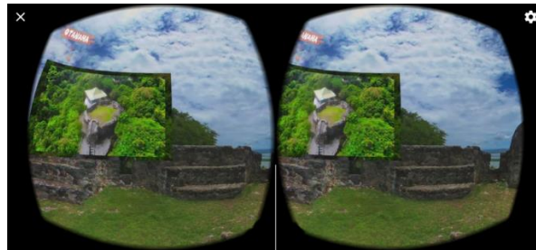
Gambar 3.2 Video yang ditampilkan untuk VR box .

Gambar diatas merupakan proses pengunggahan video pada platform media sosial Youtube , proses ini memakan waktu bervariasi tergantung besar kecilnya ukuran video yang akan diunggah. Pada saat ini Youtube secara otomatis dapat membaca format video 360 panorama, kemudian langkah yang perlu dipastikan, gambar 360 yang akan diupload adalah format video.