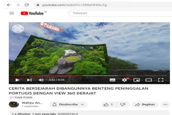
Gambar 4.6 Video yang telah diunggah.

Pada gambar di atas, adalah tampilan saat menggunakan menu yang disediakan untuk menonton video menggunakan alat VR box atau Virtual Reality box .