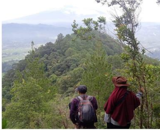
Gambar 3.3 : Puncak Bukit Karang