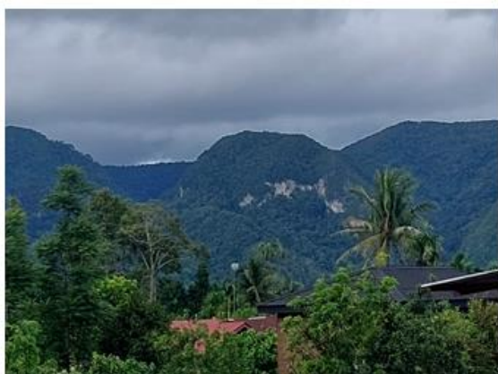
Gambar 3.7 : Puncak Bukik Bulek

Puncak Bukik Bulek terletak di Jorong Koto tuo Nagari Simarasok. Bernama puncak bukit bulek dikarenakan ini merupakan buncak bukit yang mana bukitnya berbentuk bulat. Geosite yang ditemukan berupa morfologi perbukitan dan batuan malihan berkarbon. Berikut merupakan Puncak Bukik Bulek