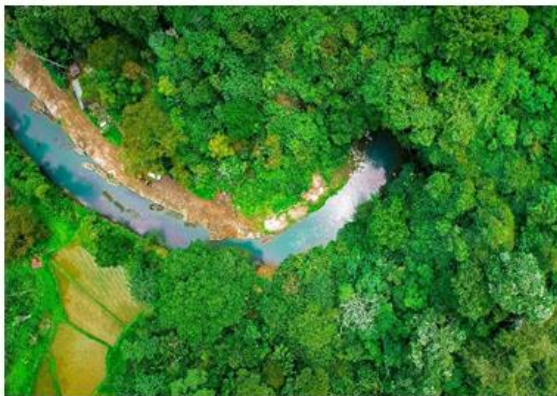
Gambar 3.2 : Sungai Kars Agam

Sungai Karst Batang Agam sering disebut masyarakat Sungai Agam Tabik. Sungai Agam Tabik merupakan sungai bawah tanah yang muncul kembali di permukaan (Resurgensi), yang keluar atau muncul Kembali di mulut goa karst Ngalau Agam Tabik (Goa Nan Panjang) yang berada di Nagari Simarasok. Bagian hulu dari sungai ini merupakan sungai hilang atau dalam istilah geologi disebut Inflow, yang mengacu pada aliran masuk air ke dalam suatu sistem atau formasi geologi (goa). Berikut Sungai Agam Tabik yang berada di Nagari Simarasok padat dilihat pada gambar dibawah.