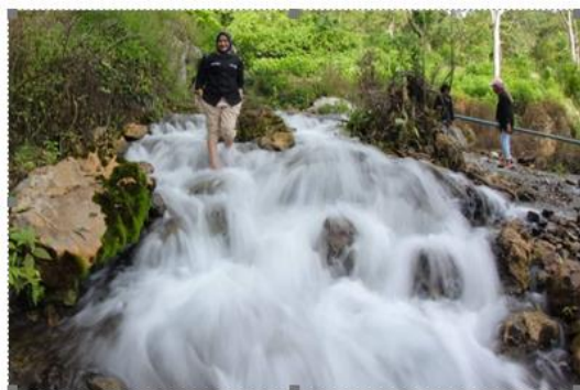
Gambar 3.5 : Mata air putih

Mata Air Batu Putih terletak di Nagari Simarasok. Bernama Mata Air Batu Putih karena mata air ini berasal dari pegunungan yang memiliki tebing bebatuan berwarna putih. Geosite yang ditemukan di berupa mata air yang muncul dari formasi batuan karst.