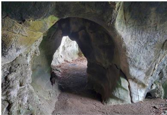
Gambar 3.4 : Goa Bunian

Ngalau bunian merupakan salah satu goa yang berada di Nagari Simarasok. Goa bunian berada diatas perbukitan nigari simaraok, dinamakan goa bunian karena pada zaman belanda goa ini dijadikan tempat persembunyian dari penjajahan. Didalam goa ini tidak terdapat ornamen goa karena Goa Bunian ini merupakan goa yang kering dan pada saat ini pada goa tersebut tidak ada aktifitas pelarutan.