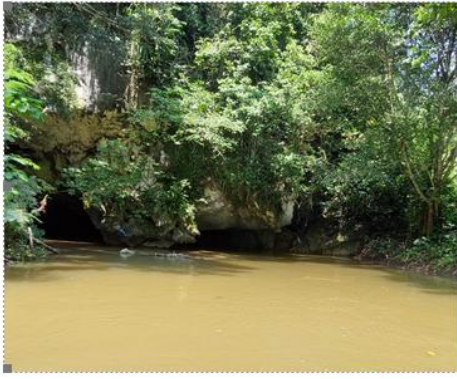
Gambar 3.1 : Goa Agam Tabik