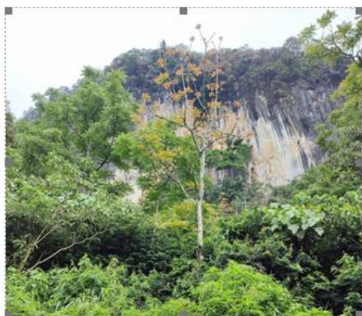
Gambar 3.6 : tebing Batu Putih

Tebing Batu Putih terletak di Nagari Simarasok. Dinamakan tebing batu putih karena tebing pebukitan yang memiliki batuan yang berwarna putih. Geosite yang ditemukan berupa morfologi perbukitan dan batuan gamping berkarbonat. Berikut merupakan Tebing Batu Putih yang terdapat di Nagari Simarasok.