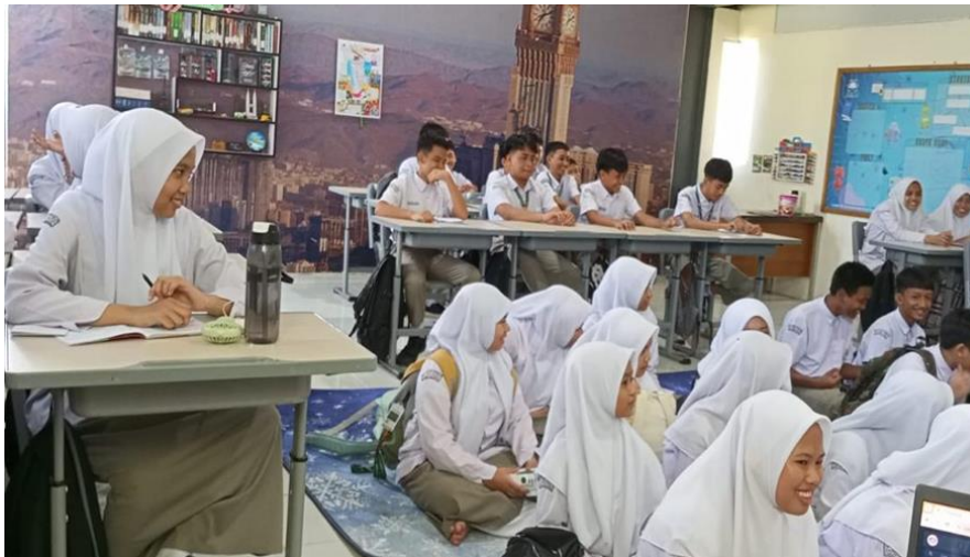
Gambar 4. Suasana Belajar Dengan Pendekatan Humanistik

Guru juga memberikan kebebasan kepada siswa untuk menyesuaikan cara belajar sesuai kebutuhan dan kenyamanan masing-masing, baik melalui media visual, kerja kelompok, maupun diskusi kelas. Pendekatan tersebut membuat siswa lebih mudah memahami materi pembelajaran dan lebih aktif selama proses belajar berlangsung. Suasana pembelajaran yang terbuka dan komunikatif juga mendorong siswa untuk membangun rasa percaya diri serta meningkatkan motivasi dalam mengikuti pembelajaran Geografi. Suasana pembelajaran memperlihatkan bahwa siswa aktif berdiskusi dan terlibat dalam proses pembelajaran, sedangkan guru berperan sebagai fasilitator yang mendampingi jalannya diskusi.