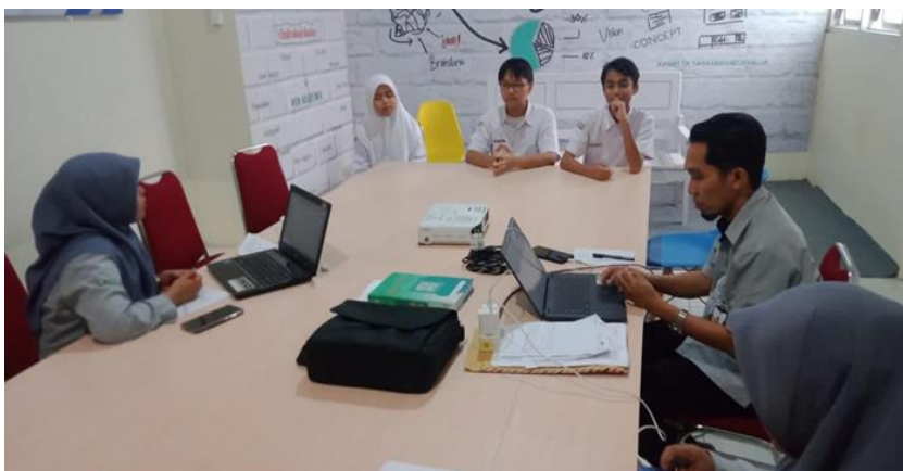
Gambar 4. Wawancara mendalam kepada guru Geografi dan Siswa

Pendekatan tersebut membuat siswa menjadi lebih peka terhadap isu-isu lingkungan dan lebih aktif dalam memberikan tanggapan selama proses pembelajaran. Pembelajaran Geografi tidak hanya berfungsi sebagai proses transfer pengetahuan, tetapi juga sebagai sarana pembentukan karakter peduli lingkungan dan empati sosial pada diri siswa. Proses wawancara dengan guru dan siswa menunjukkan bahwa penerapan pendekatan humanistik membantu menciptakan hubungan pembelajaran yang lebih terbuka, nyaman, dan komunikatif antara guru dan peserta didik.