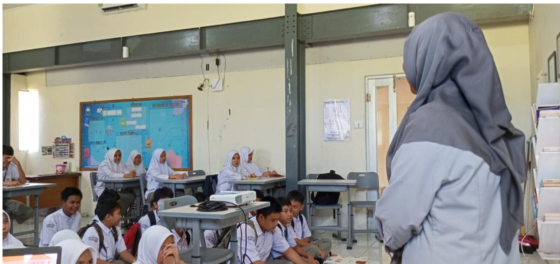
Gambar 3. Observasi Interaksi Guru Dan Siswa

Interaksi antara guru dan siswa selama proses pembelajaran berlangsung menunjukkan adanya penerapan komunikasi yang lebih terbuka dan dialogis. Guru memberikan kesempatan kepada siswa untuk berdiskusi dan menyampaikan pendapat terkait materi yang dipelajari. Interaksi yang terbangun dalam pembelajaran mencerminkan penerapan pendekatan humanistik yang menempatkan siswa sebagai subjek utama dalam proses belajar.