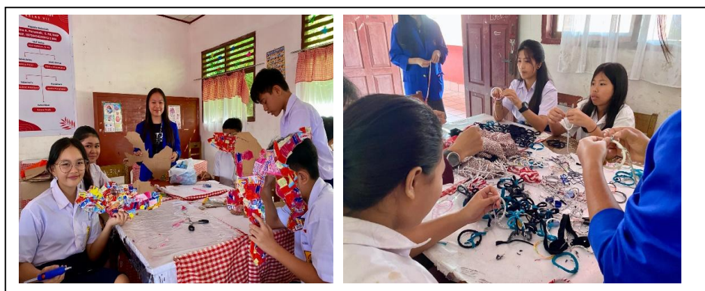
Gambar 6. Pengolaan Sampah Anorganik

Selain sampah organik, pelatihan juga diberikan untuk pengolahan sampah anorganik. Siswa diajarkan untuk memilah sampah berdasarkan jenisnya dan memanfaatkan kembali sampah anorganik yang masih bisa digunakan, seperti botol plastik dan kertas bekas. Siswa diajak untuk berkreasi dengan membuat berbagai produk daur ulang dari sampah anorganik, seperti pembuatan peta dari sampah kemasan plastik, pembuatan penghapus papan tulis dari kain bekas, serta pembuatan eco bag dari sampah botol gelas plastik. Pelatihan ini bertujuan untuk meningkatkan kesadaran siswa akan pentingnya pengelolaan sampah anorganik dan meminimalkan limbah yang dibuang ke lingkungan.