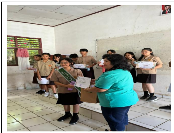
Gambar 9. Siswa Yang Terpilih Sebagai Caraka Lingkungan SMP Negeri 8 SATAP Tondano