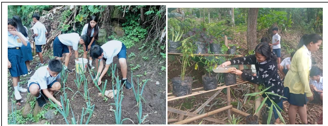
Gambar 8. Membuat Apotik dan Dapur Hidup di Halaman Belakang Sekolah

Sebagai bagian dari pemberdayaan lingkungan, siswa diajak untuk membuat apotek hidup dan dapur hidup di halaman belakang sekolah. Apotek hidup diisi dengan tanaman-tanaman obat yang bermanfaat untuk kesehatan, sementara dapur hidup diisi dengan tanaman sayuran dan rempah-rempah yang dapat digunakan dalam kegiatan memasak. Melalui kegiatan ini, siswa belajar untuk memanfaatkan lahan sekolah secara optimal dan memahami pentingnya menanam tanaman yang berguna bagi kehidupan sehari-hari.