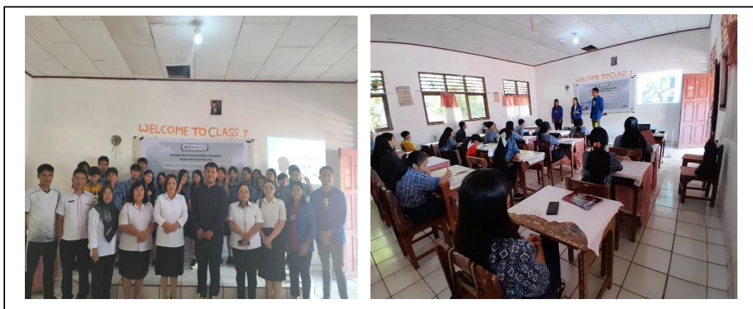
Gambar 3. Sosialisasi kegiatan zoomer eco di SMP Negeri 8 SATAP Tondano

Kegiatan awal dimulai dengan sosialisasi program ZOOMER ECO kepada seluruh guru dan siswa di SMP Negeri 8 SATAP Tondano. Sosialisasi ini bertujuan untuk memberikan pemahaman mengenai pentingnya kecerdasan ekologis dan peran serta seluruh warga sekolah dalam menjaga lingkungan hidup. Selama sosialisasi, tim pengabdian memaparkan tujuan, manfaat, serta langkah-langkah yang akan dilakukan dalam program ini. Para guru dan siswa menunjukkan antusiasme tinggi dan menyatakan dukungannya terhadap program ini, yang diharapkan dapat memberikan dampak positif bagi lingkungan sekolah dan sekitarnya.