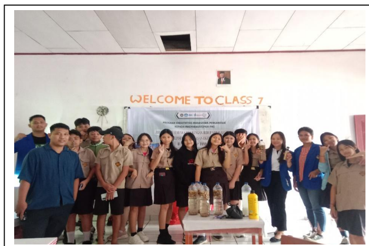
Gambar 5. Pelatihan Pengolahan Sampah organik

Kegiatan inti dimulai dengan pemberian materi dan pelatihan tentang pengolahan sampah organik. Siswa diperkenalkan pada teknik-teknik komposting yang dapat dilakukan dengan mudah di lingkungan sekolah atau rumah. Pelatihan ini melibatkan demonstrasi langsung mengenai cara membuat kompos dari sisa makanan dan sampah organik lainnya. Siswa juga diajak untuk mempraktikkan sendiri pembuatan kompos di bawah bimbingan para fasilitator. Siswa juga diberikan pelatihan pembuatan pupuk cair dari kulit pisang. Hasilnya, siswa mampu mengolah sampah organik menjadi pupuk yang dapat digunakan untuk tanaman di sekolah.