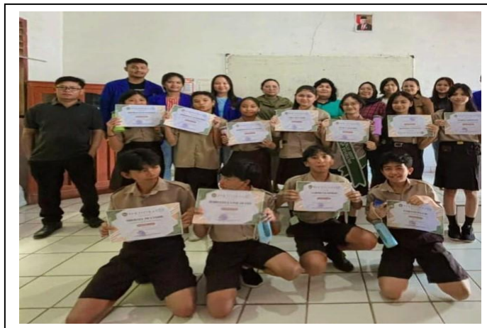
Gambar 4. 12 Siswa Calon Caraka SMP Negeri 8 SATAP Tondano

Ke-12 siswa yang terpilih sebagai calon Caraka diharapkan dapat menjadi duta lingkungan di sekolah dan memimpin teman-temannya dalam mengimplementasikan berbagai program lingkungan yang telah dipelajari.