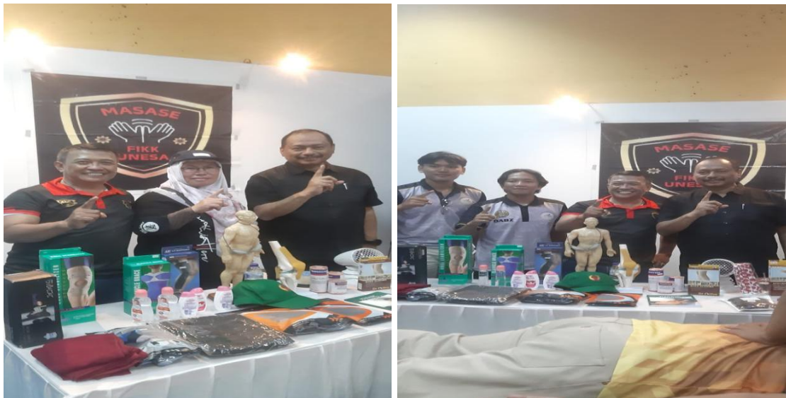
Gambar 2: Pendampingan Mahasiswa saat Praktek

Diskusi interaktif yang dilakukan selama sesi sosialisasi juga memperlihatkan bahwa peserta sangat antusias dalam menggali informasi lebih dalam terkait penerapan sport massage, baik untuk kebutuhan pribadi maupun komunitas. Terdapat beberapa peserta bahkan menyatakan ketertarikan untuk mendalami bidang ini lebih lanjut. Beberapa peserta menyatakan komitmen untuk mengembangkan keterampilan lebih lanjut melalui pelatihan lanjutan. Selain itu, terdapat ide kolaborasi untuk membuka layanan sport massage secara kelompok, terutama di lingkungan kampus.