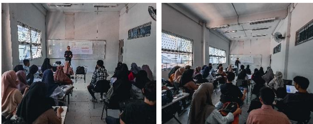
Gambar 1. Pelatihan Penulisan Karya Tulis Ilmiah bagi Mahasiswa Jurusan Pendidikan Ekonomi, Universitas Negeri Gorontalo

Pelatihan dilaksanakan secara tatap muka dengan pendekatan interaktif yang menggabungkan penyampaian materi, diskusi, dan praktik langsung. Kegiatan diawali dengan pelaksanaan pre-test guna mengukur pemahaman awal peserta terhadap penulisan ilmiah. Materi pelatihan disampaikan secara bertahap dan sistematis, dimulai dari pengenalan struktur penulisan ilmiah berbasis model IMRaD (Introduction, Method, Results, and Discussion), penggunaan bahasa formal dan istilah teknis sesuai bidang ekonomi, hingga teknik penyusunan kutipan dan referensi berdasarkan gaya APA edisi ke-7.