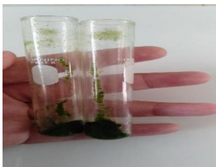
Gambar 1. Pasta Mikroalga Coccolithophore sp.

Mikroalga Coccolithophore sp yang telah dikultur, diambil dengan proses pemanenan menggunakan setrifus untuk mengambil padatan dari mikroalga kemudian dikeruk dan disentrifugasi selama 10 menit. Dan diambil pasta mikroalga. Pasta Mikroalga Coccolithophore sp. dapat dilihat pada Gambar 1.