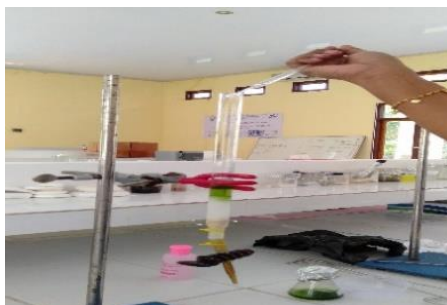
Gambar 2. Contoh Kolom

Fraksi yang keluar ditampung setiap 2 mL, dan waktu munculnya analit pertama (menit awal dan akhir keluarnya analit) dicatat untuk setiap fraksi. Penting untuk memastikan penambahan fase gerak dilakukan tepat waktu agar cairan di atas fase diam tidak habis. Contoh kolom pada gambar 2