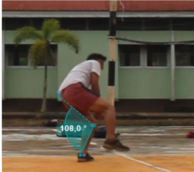
Gambar 1. Sudut Mendarat

Pada tahap ini, setelah menjalankan teknik Open Smash , seorang mahasiswa menyelesaikan fase pendaratan dengan mendarat pada kaki kiri, sehingga menyebabkan sudut lutut membentuk sudut sebesar 108,0^\circ .