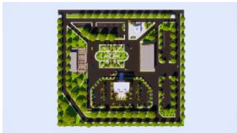
Gambar 1. Hasil Rancangan Tata Massa Bangunan

Tata massa bangunan di Badan Perencanaan, Penelitian Dan Pengembangan (BAPPPELITBANG) disesuaikan dengan kondisi kawasan yang sudah ada sebelumnya, dan ditambahkan dengan fasilitas yang dibutuhkan yaitu auditorium, cafe resto , musholah, pos jaga, dan tempat parkir disetiap area bangunan. Sedangkan untuk penataan ruang dalam kantor dikategorikan berdasarkan sifat ruang, yaitu publik, servis, semi publik dan privat.