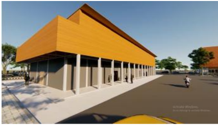
Gambar 6. Hasil Rancangan Eksterior Laboratorium (Sumber: Hasil Analisa, 2022)