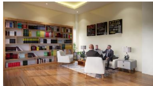
Gambar 11. Hasil Rancangan Interior Perpustakaan