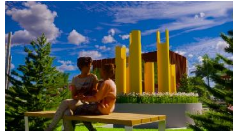
Gambar 10. Hasil Rancangan Sclupture