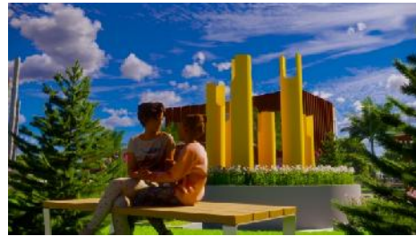
Gambar 10. Hasil Rancangan Sculpture (Sumber: Hasil Analisa, 2022)