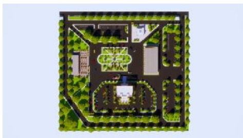
Gambar 1. Hasil Rancangan Tata Massa Bangunan

Tata massa bangunan di Badan Perencanaan, Penelitian Dan Pengembangan (BAPPPELITBANG) disesuaikan dengan kondisi kawasan yang sudah ada sebelumnya, dan ditambahkan dengan fasilitas yang dibutuhkan yaitu auditorium, cafe resto , musholah, pos jaga, dan tempat parkir disetiap area bangunan. Sedangkan untuk penataan ruang dalam kantor dikategorikan berdasarkan sifat ruang, yaitu publik, servis, semi publik dan privat.