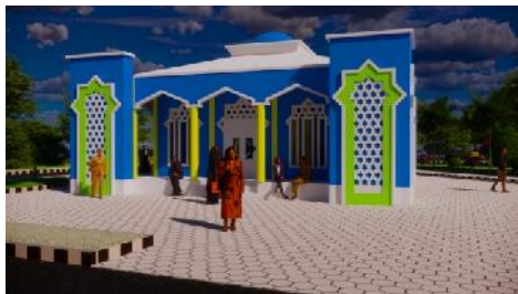
Gambar 8. Hasil Rancangan Masjid

Pada bangunan utama kantor terdapat perpustakaan, yang merupakan fasilitas tambahan sehingga tamu dapat menunggu saling membaca dengan desain interior ini menggunakan warna dasar cream dengan material lantai vinyl .