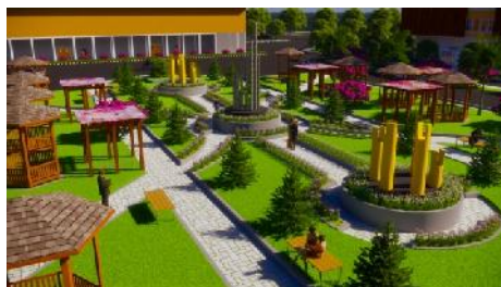
Gambar 9. Hasil Rancangan Taman