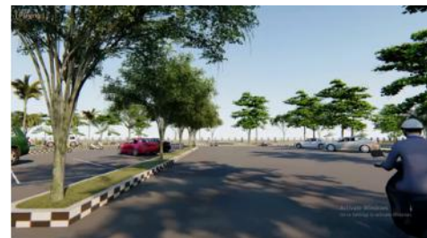
Gambar 3. Hasil Rancangan Tempat Parkir