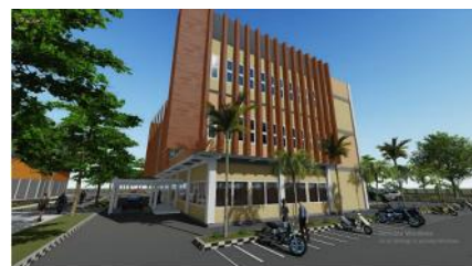
Gambar 4. Hasil Rancangan Fasad Kantor

Bentuk bangunan luar Kantor BAPPPELITBANG di desain dengan menggunakan pendekatan arsitektur modern fungsionalisme yang diterapkan pada penggunaan material dan fasad bangunan. Pada beberapa fasad bangunan digunakan sun shading sebagai filter cahaya matahari langsung.