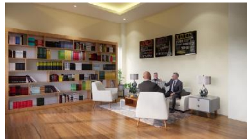
Gambar 11. Hasil Rancangan Interior Perpustakaan (Sumber: Hasil Analisa, 2022)