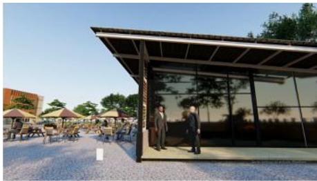
Gambar 7. Hasil Rancangan Eksterior Café Resto