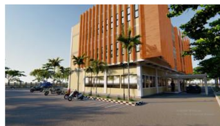
Gambar 5. Hasil Rancangan Eksterior Kantor (Sumber: Hasil Analisa, 2022)