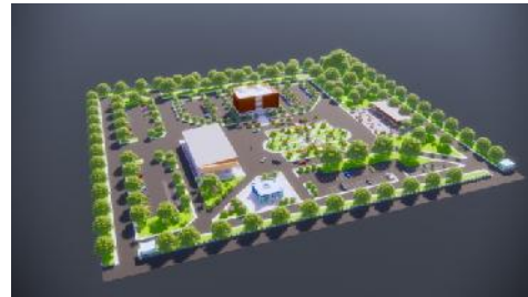
Gambar 2. Hasil Perancangan Tata Massa Bangunan