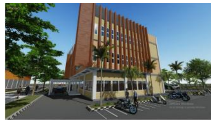
Gambar 4. Hasil Rancangan Fasad Kantor

Bentuk bangunan luar Kantor BAPPPELITBANG di desain dengan menggunakan pendekatan arsitektur modern fungsionalisme yang diterapkan pada penggunaan material dan fasad bangunan. Pada beberapa fasad bangunan digunakan sun shading sebagai filter cahaya matahari langsung.