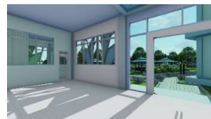
Gambar 2. Penerapan daylight and health

Pada bangunan diterapkan penggunaan bukaan yaitu berupa jendela dan ventilasi yang bertujuan untuk memberikan sinar matahari agar masuk ke dalam gedung dan mempercepat eliminasi racun.