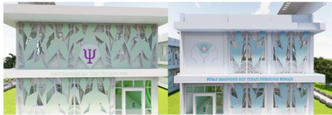
Gambar 3. Penerapan daylight and health

Dapat dilihat pada rancangan gedung utama penanganan anak dan remaja yang didesain dengan beda warna yakni hijau dan biru