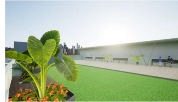
Gambar 5. Prinsip Balance

Prinsip balance diterapkan yaitu dengan meletakkan tumbuhan pada bagian atap dengan tujuan meredam panas yang masuk ke dalam gedung. Prinsip balance hanya diterapkan pada gedung utama yaitu gedung penanganan anak dan gedung penanganan remaja sesuai dengan kebutuhan dan kenyamanan pasien pada gedung.