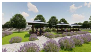
Gambar 4. Penerapan Prinsip bau

Pada sekitaran gedung diletakkan tanaman berupa aroma terapi yang menjadi salah satu penerapan prinsip healing environment .