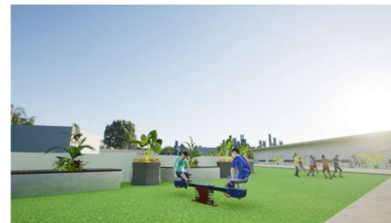
Gambar 5. Area Bermain dan santai

Tujuan menggunakan atap plat dengan tanaman hijau di atasnya bukan hanya sekedar meredam panas ke gedung, menerapkan prinsip healing environment , namun juga sebagai tempat refreshing dan terapi anak serta remaja.