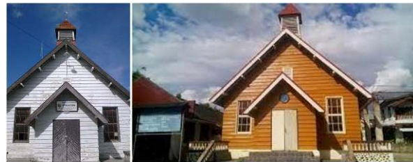
Gambar 2. GMIBM Pusat Kotamobagu

tradisi masa lalu dengan dinamika kehidupan kontemporer yang terus berkembang.