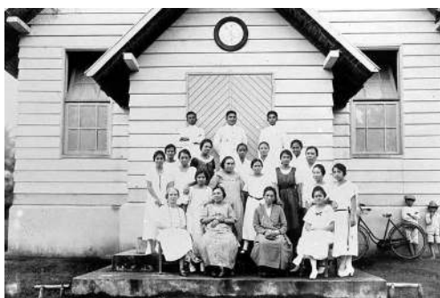
Gambar 1. Potret Jemaah di Depan GMIBM

penyebaran nilai-nilai Kristiani di tengah dominasi kekuasaan kolonial. Seiring berjalannya waktu konstruksi dan renovasi yang dilakukan mempertahankan warisan sejarahnya sembari menyesuaikan dengan kebutuhan masa kini. Saat ini Gereja Masehi Injili Bolaang Mongondow tidak hanya berfungsi sebagai tempat ibadah rutin, tetapi juga telah berkembang menjadi pusat aktivitas sosial, pendidikan serta pelayanan kemasyarakatan. Aktivitas-aktivitas keagamaan yang diadakan secara berkala, bersama dengan program-program pemberdayaan masyarakat, menegaskan bahwa bangunan tersebut tetap relevan dan berperan strategis dalam kehidupan keagamaan dan sosial komunitas lokal.