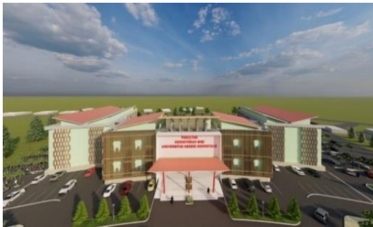
Gambar 7. Penerapan bentuk Gigi pada Fasad

Gigi merupakan salah satu komponen pembentuk tubuh manusia yang penting. Penerapan bentuk gigi pada fasad bangunan fakultas kedokteran gigi adalah sebagai identitas bangunan sehingga membedakan bangunan fakultas kedokteran gigi dengan bangunan lain yang memiliki ciri dan identitas nya masing-masing.