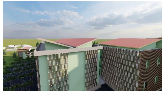
Gambar 3. Penggunaan Bentuk Atap

hal ini bentuk atap. Bangunan fakultas kedokteran gigi tetap menggunakan bentuk atap pelana.