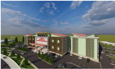
Gambar 2. Penerapan Tema Arsitektur

Arsitektur kontekstual adalah sebuah metode pendekatan perancangan arsitektur, dimana rancangan akan diwujudkan dengan adanya kesinambungan dengan lingkungan sekitarnya. Prinsip kontras dan harmoni dalam segi bentuk dapat dilihat dengan adanya keberagaman bentuk yang ada pada bangunan yang sangat mencolok atau ukuran yang sama pada tampak bangunan (Thania & Purwantiasning, 2020).