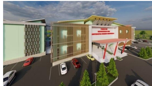
Gambar 4. Tampilan Fisik pada Fasad

Tampilan fisik bangunan menerapkan konsep arsitektur kontekstual dengan tampilan fasad bangunan menggunakan secondary skin yang berbentuk seperti gigi dengan penambahan aksesoris garis vertikal dan horisontal. Penggunaan dengan bentuk fasad tersebut selain sebagai identitas juga bernilai estetik.