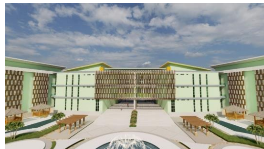
Gambar 5. Penggunaan Secondary Skin

Secondary skin menggunakan rangka hollow yang dibungkus dengan bahan Aluminium Composite Panel (ACP) motif kayu.