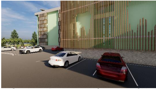
Gambar 6. Penggunaan Secondary Skin