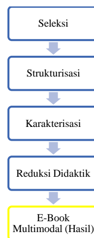
Gambar 1. Tahapan Metode Pengembangan 4STMD

Penelitian ini merupakan penelitian pengembangan dengan menggunakan metode pengembangan bahan ajar 4STMD ( 4 Steps Teaching Material Development ) dari (Anwar, 2014). Adapun tahapan metode pengembangan ini dapat dilihat pada gambar 1.