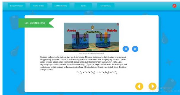
Gambar 4. Video yang Menayangkan Aspek Multiple Representasi dalam Bahan Ajar

Setelah dilakukan uji coba terbatas pada bahan ajar ini diperoleh hasil bahwa e-book multimodal ini pada kategori layak untuk digunakan.