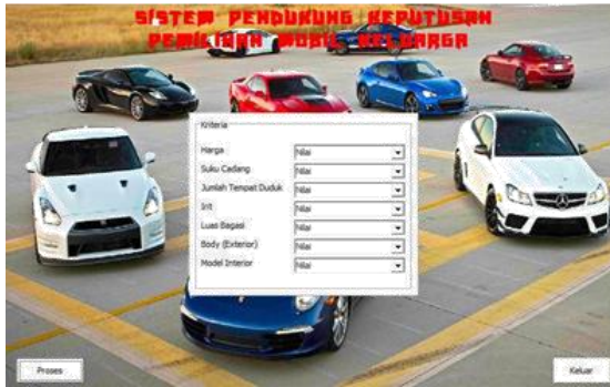
Gambar 3. Menu Penilaian