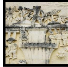
Gambar 16: Relief Patung Pak Nani Wartabone

Berdasarkan gambar di atas relief ini menampilkan patung Pak Nani Wartabone merupakan pelopor “Gerakan Merah Putih 23 Januari 1942”. Pak Nani Wartabone merupakan pahlawan kemerdekaan dari Provinsi Gorontalo. Pada gambar di atas pak Nani Wartabone yang berdiri dengan gagah berani. Dengan tangan kanan menunjuk ke salah satu arah dan tangan kiri memegang senapan. Relief ini memiliki ukuran panjang 155 cm dan lebar 100 cm.