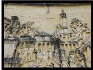
Gambar 19: Relief Masjid Agung Baiturrahim

Berdasarkan gambar di atas relief ini menampilkan 6 orang pria berada di depan Masjid Agung Baiturrahim. Di Gorontalo masyarakatnya mayoritas memeluk agama Islam. Relief ini memiliki panjang 150 cm dan lebar 130 cm.