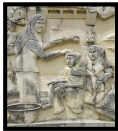
Gambar 4: Mo'muhuto (siraman)

Gambar di atas merupakan adegan dari prosesi momuhuto yang terdapat tiga figur wanita sedang melakukan tradisi mo'muhuto . Tradisi momuhuto atau siraman merupakan salah satu adat