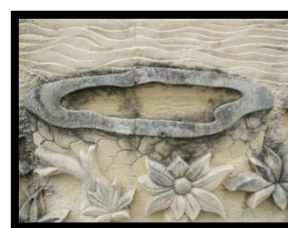
Gambar 18: Relief Benteng Otanaha

Berdasarkan gambar di atas relief ini menampilkan benteng Otanaha yang merupakan salah satu cagar budaya. benteng otanaha ini merupakan peninggalan masa penjajahan belanda di provinsi Gorontalo. Relief ini memiliki ukuran panjang 27 cm dan lebar 55 cm.