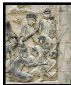
Gambar 6: Relief Mo Luna (Sunatan)

Gambar di atas merupakan relief yang menampilkan adegan anak kecil yang akan disunat. di Gorontalo anak anak yang berusia 8 tahun atau lebih akan melakukan sunat seperti ajaran agama islam karena mayoritas masyarakat Gorontalo memeluk agama Islam. Relief ini memiliki ukuran panjang 130 cm dan lebar 80 cm.