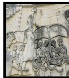
Gambar 5: Mopohuta'a To Pingge