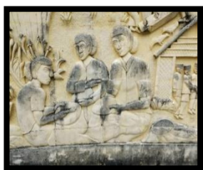
Gambar 13: Pembuat Karawo

Berdasarkan gambar di atas relief menampilkan 3 wanita yang sedang membuat kerajinan karawo, kerajinan karawo merupakan salah satu ciri khas daerah Provinsi Gorontalo. Relief ini memiliki ukuran panjang 120 cm dan lebar 158 cm.