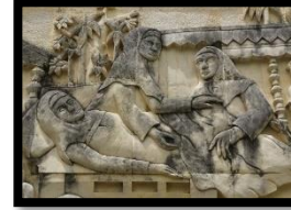
Gambar 9: Relief Molonthalo

Berdasarkan gambar di atas relief ini menampilkan adegan prosesi adat molonthalo . Molonthalo merupakan adat provinsi Gorontalo yang dilaksanakan pada perempuan yang sedang mengandung anak pertama di usia perut 7 bulan. Relief ini memiliki panjang 180 cm dan lebar 100 cm