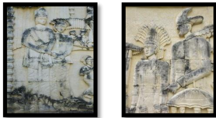
Gambar 3: Pengantin 1 Gambar Pengantin 2

Relief ini menampilkan figur sepasang mempelai yang menggunakan pakaian adat Gorontalo. Relief pengantin 1 ini memakai pakaian adat untuk prosesi akad nikah dapat dilihat pada tudung kepala mempelai pria yang dibiasa disebut payunga tilabatayila dan pakaian adat yang dipakai mempelai wanita biasa disebut wolimomo . Relief memiliki panjang 300 cm dan lebar 158 cm, sedangkan relief