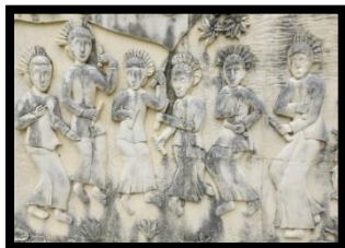
Gambar 11: Relief Tarian Tidi

Berdasarkan gambar di atas relief ini menampilkan adegan 6 orang perempuan yang sedang melakukan tari tidi . Tari tidi merupakan salah satu kesenian Provinsi Gorontalo yang biasanya ditampilkan dalam acara penyambutan tamu, pembeatan, dan pernikahan. Relief ini memiliki ukuran panjang 120 cm dan lebar 200 cm.