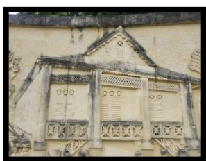
Gambar 17: Relief Rumah Adat Dulohupa

Berdasarkan gambar di atas relief menampilkan Rumah Adat Dulohupa yang merupakan salah satu Rumah Adat yang ada di Gorontalo, Rumah Adat ini dulu digunakan untuk upacara adat di Gorontalo. Relief ini memiliki ukuran panjang 300 cm dan lebar 250 cm.