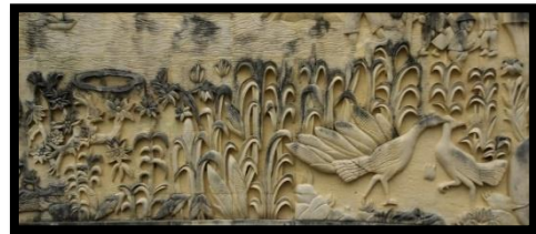
Gambar 20: Relief Jagung dan Burung Maleo

Berdasarkan gambar di atas relief ini menampilkan tumbuhan Jagung dan 2 Burung Maleo. Jagung merupakan tanaman yang dapat tumbuh subur di Gorontalo. dan Burung Maleo merupakan hewan endemik Sulawesi. Relief ini memiliki panjang 130 cm dan 330 cm.