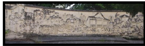
Gambar 2: relief di lingkungan rumah adat

Berdasarkan letak penempatan relief cukup strategis karena berada di samping rumah adat dulohupa yang merupakan tempat pariwisata yang dikelola oleh UPTD Dinas Pariwisata Provinsi Gorontalo.