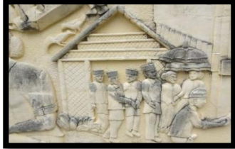
Gambar 10: Modelo (Unduh Mantu)

Berdasarkan gambar di atas relief ini menampilkan adegan kedua mempelai diantarkan ke kediaman orang tua mempelai pria. Modelo merupakan salah satu adat dari daerah Provinsi Gorontalo. Relief ini memiliki ukuran panjang 120 cm dan lebar 92 cm.