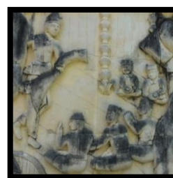
Gambar 12: Tari Molapi Saronde (Sumber: Dokumen Peneliti, 2023)

Berdasarkan gambar di atas relief ini menampilkan adegan calon mempelai pria yang sedang menari tarian molapi saronde . Tarian molapi saronde merupakan rangkaian dari adat pernikahan yang biasanya dilakukan pada saat melakukan adat hui mopotilandahu (malam pertunangan). Relief ini memiliki ukuran 130 cm dan lebar 120 cm.