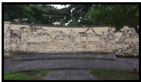
Gambar 1: Relief

Rumah Adat Dulohupa adalah salah satu warisan budaya Gorontalo yang harus dilestarikan karena memiliki nilai kesejarahan dan estetika yang tinggi. Rumah adat ini telah ditempatkan secara khusus di kota Gorontalo, salah satu ciri dari Rumah Adat Dulohupa tersebut adalah adanya relief yang terdapat di halaman sebelah kiri Rumah Adat Dulohupa.