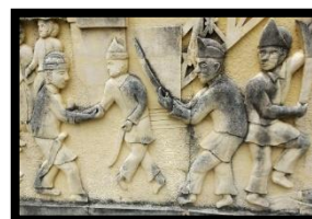
Gambar 14: Relief Bela Diri ( Langga )

Berdasarkan gambar di atas relief ini menampilkan 4 orang pria yang sedang memperagakan beladiri khas Provinsi Gorontalo yaitu bela diri langga . Relief ini memiliki ukuran panjang 120 cm dan lebar 130 cm.