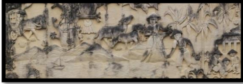
Gambar 15: Relief Profesi

Berdasarkan gambar di atas relief ini menampilkan 3 profesi yang dilakukan oleh masyarakat Provinsi Gorontalo yaitu kusir bendi atau delman, dua orang nelayan yang sedang menjala ikan dilaut, 3 orang petani. Relief ini memiliki ukuran panjang 120 cm dan lebar 428 cm.