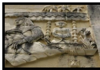
Gambar 8: Mo Hatamu Qur'ani

Panel 6: Khatam Al-Qur'an Atau Mo Hatamu Qur'ani