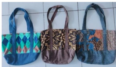
Gambar 3: Hasil produk jahitan

dengan menggunakan bahan perca jeans dan batik.