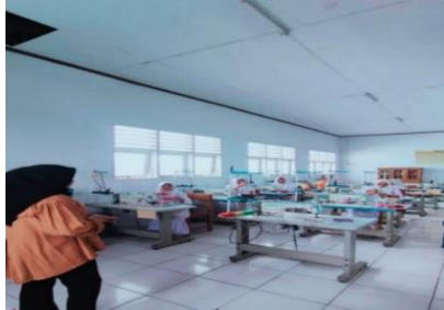
Gambar 2: Pembukaan Pembelajaran dan pembagian kelompok

dengan memperkenalkan diri kepada siswa, berdoa, dan mengecek kehadiran siswa.