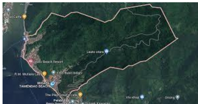
Gambar 1. Peta lokasi Leato Utara

Kelurahan Leato Utara, yang terletak di kawasan pesisir Teluk Tomini, Kota Gorontalo, memiliki potensi wisata yang besar dengan pantai-pantai berpasir putih, terumbu karang yang kaya akan keanekaragaman hayati, serta budaya lokal yang unik. Keindahan alamnya menjadikannya ideal untuk aktivitas snorkeling dan diving, sementara lokasi strategisnya dekat dengan pusat kota Gorontalo memudahkan akses bagi wisatawan.