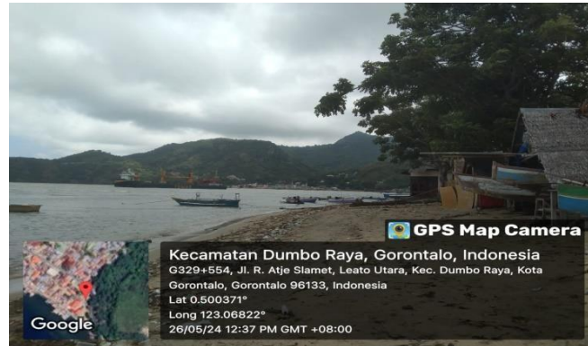
Gambar 3. Kawasan Pesisir Kelurahan Leato Utara

Teluk Tomini, yang terletak di bagian tengah Pulau Sulawesi, Indonesia, merupakan salah satu teluk terbesar di negeri ini dan dikenal sebagai surga bagi keanekaragaman hayati laut. Dengan luas sekitar 6 juta hektar, Teluk Tomini mencakup beberapa provinsi, termasuk Gorontalo, Sulawesi Tengah, dan Sulawesi Utara. Teluk ini dikelilingi oleh pegunungan dan hutan tropis yang masih asri, memberikan pemandangan alam yang spektakuler dan lingkungan yang relatif belum terjamah.