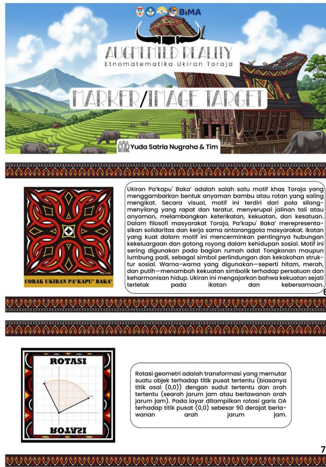
Gambar 2. Produk Marker yang dikembangkan

Pada tahap pengembangan, rancangan yang telah disusun sebelumnya kemudian direalisasikan dalam bentuk prototipe media pembelajaran berbasis AR. Proses pengembangan dilakukan menggunakan perangkat lunak Unity 3D dengan Vuforia Engine, serta aplikasi pengolah desain grafis untuk memvisualisasikan motif ukiran Toraja ke dalam bentuk objek tiga dimensi. Pembuatan prototipe dimulai dari penyusunan konten matematis terkait materi transformasi geometri yang diintegrasikan dengan motif ukiran khas Toraja. Integrasi dilakukan melalui desain marker/target image yang ketika dipindai oleh perangkat gawai akan memunculkan objek 3D disertai audio penjelasan konsep.