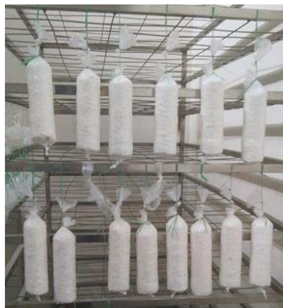
Gambar 1. Tempe, kemasan & rak fermentasi.

Hasil ini menunjukkan bahwa peningkatan efisiensi pada sisi bahan baku dan distribusi serta penerapan strategi harga berbasis analisis ekonomi dapat meningkatkan profitabilitas UMKM pangan seperti UPH Ero Mate'ne.