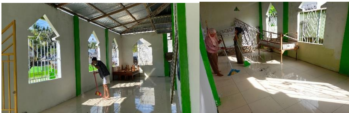
Gambar 2. Program Jumat Bersih Di Masjid Dekat Posko

Dalam Program Kerja KKN MBKM di Desa Hulawa, salah satu kegiatan yang menjadi tradisi adalah "Jumat Bersih" yang diadakan di masjid setiap pagi pada hari jumat. Kegiatan ini tidak hanya bertujuan untuk menjaga kebersihan lingkungan tempat ibadah, tetapi juga sebagai upaya untuk memperkokoh nilai-nilai kebersamaan dan kepedulian sosial di antara masyarakat desa. Setiap hari jumat sebelum pelaksanaan sholat Jumat, tim KKN bersama-sama dengan masyarakat desa berkumpul di masjid. Dengan membentuk kelompok kecil untuk membersihkan area sekitar masjid, termasuk halaman masjid, tempat wudu, dan ruang dalam masjid (Gambar 2).