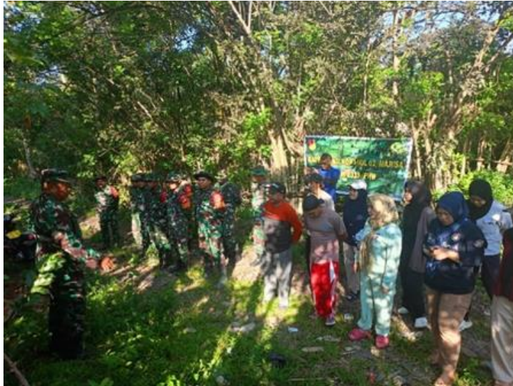
Gambar 3. Program Kerja Bakti Mahasiswa KKN Dengan Membersihkan Atau Penimbunan Jalan

Program kegiatan peduli lingkungan lainnya, mahasiswa KKN melaksanakan kerja bakti. Spirit gotong-royong yang terbentuk dari kegiatan ini turut menguatkan kebersamaan dan solidaritas di antara semua pihak yang terlibat. Program kerja bakti membersihkan infrastruktur jalan desa dan lainnya. Program KKN MBKM Desa Hulawa, bukan hanya menciptakan lingkungan yang lebih bersih dan nyaman tetapi juga membangun nilai-nilai kebersamaan dan kepedulian sosial yang kuat di antara masyarakat desa (Gambar 3).