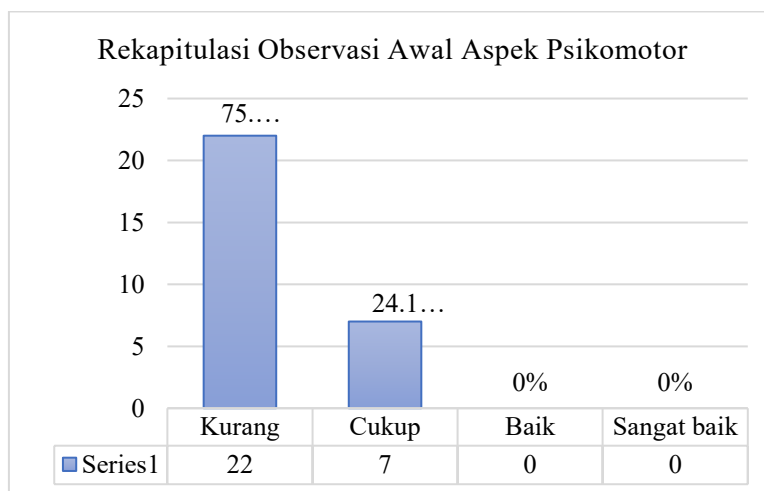
Gambar 1 Diagram Hasil Rekapitulasi Data Awal Sumber Penelitian : Teguh Firmansyah Lamasese. 2025

Berdasarkan kegiatan penelitian tindakan kelas yang sudah dilakukan dengan judul “Meningkatkan Teknik Dasar Servis Bawah Bola Voli Terhadap Siswa Kelas VII-A SMP Negeri 1 Molibagu Menggunakan Metode Group Investigation (GI)” diperoleh hasil sebagai berikut : Hasil deskripsi rekapitulasi data awal sebelum diberikan tindakan memperlihatkan bahwa mayoritas murid belum menunjukkan adanya peningkatan hasil belajar servis bawah pada bola voli, keseluruhan murid masih berada pada kategori “kurang”. Hal ini dibuktikan dengan rangkuman deskriptif pada tabel 4.1, hasil pembelajaran servis bawah bola voli murid kelas VII-A SMP Negeri 1 Molibagu sebelum diberikan tindakan dapat dijelaskan bahwa dari 29 murid terdapat 22 murid berada pada kategori “kurang”, dan 7 murid lainnya berada pada kategori cukup. Hasil ini belum menunjukkan hasil yang baik dengan presentase ketuntasan pembelajaran 80% memperoleh hasil minimal 76 dan maksimal 100. Tabel berikut ini akan memperjelas data hasil skor pembelajaran servis bawah bola voli dengan menggunakan metode Group Investigation (GI) murid kelas VII-A SMP Negeri 1 Molibagu dalam bentuk diagram sebagai berikut: