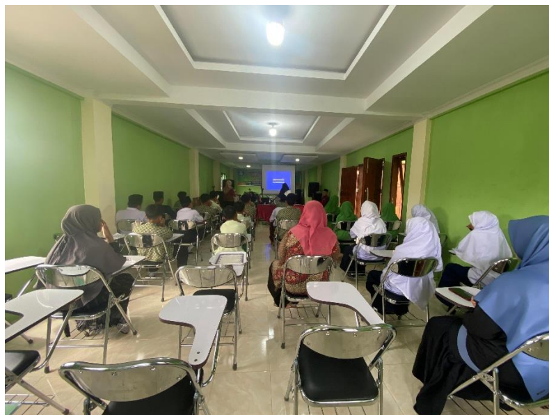
Gambar 2. Suasana Diskusi Tanya-Jawab

Materi pelatihan mengenai prinsip dasar keuangan islami (larangan riba (bunga), konsep halal dan haram, produk keuangan islami, bagaimana mengelola uang jajan dengan bijak (membuat anggaran, kebutuhan vs keinginan, tips menabung), bagaimana menghindari perilaku konsumtif, investasi sejak dini yang menjamin masa depan (pengertian investasi, jenis investasi, dan diversifikasi), menghindari hutang yang tidak produktif (bahaya hutang, jenis hutang, alternatif), zakat, infaq dan sedekah (kewajiban zakat, keutamaan infaq, berbagi itu indah), studi kasus terkait kisah sukses siswa cerdas finansial (menabung, berinvestasi, dan mengelola keuangan).