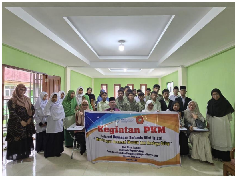
Gambar 6. Foto Bersama Tim Pengabdian Kepada Masyarakat, Guru dan Peserta

Pada saat kegiatan berakhir, maka dilakukan sesi foto bersama tim pengabdian kepada masyarakat dengan guru dan siswa/i Pondok Pesantren Al-Maarif Bukittinggi yang menjadi peserta pelatihan ini (Gambar 6 dan Gambar 7).