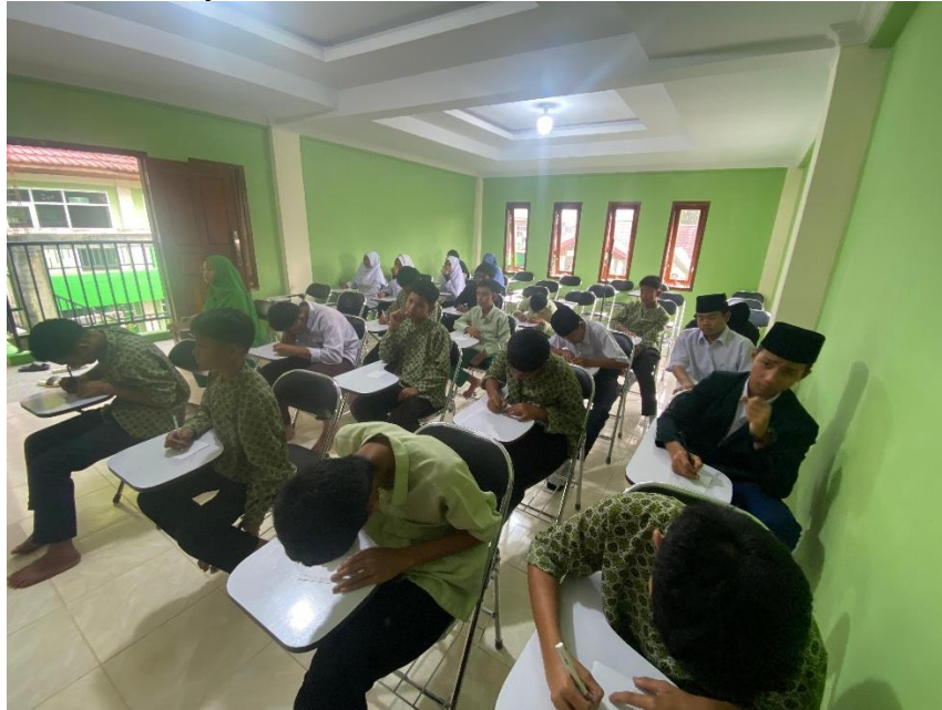
Gambar 3. Pelaksanaan Post-Test

pelatihan, diskusi, dan simulasi berlangsung (Gambar 2). Kemudian, tim pengabdian kepada masyarakat melakukan evaluasi kepada para peserta terkait hasil pelatihan dengan memberikan post-test untuk mengukur sejauhmana pemahaman siswa setelah pelatihan literasi keuangan islami (Gambar 3). Setelah itu, nilai post-test dibandingkan dengan nilai pre-test yang memuat pertanyaan yang sama (Gambar 4). Dari hasil perbandingan, menunjukkan terdapat peningkatan nilai peserta pada hampir semua item pertanyaan, yang membuktikan bahwa kegiatan pengabdian kepada masyarakat ini memberikan manfaat pemahaman siswa/i yang lebih mendalam tentang literasi keuangan islami, yang tidak hanya memperkaya pengetahuan mereka, tetapi juga membentuk pola pikir dan perilaku keuangan yang berlandaskan pada nilai-nilai syariah.