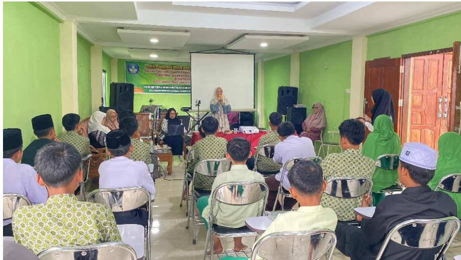
Gambar 1. Pemberian Materi Pelatihan

pelatihan dimulai, diberikan pre-test via google form kepada semua peserta untuk mengukur tingkat pemahaman awal mengenai literasi keuangan berbasis nilai islami. Kemudian, diberikan modul untuk setiap peserta yang berisi materi, studi kasus, dan simulasi transaksi berbasis syariah, yang sebelumnya telah dipersiapkan oleh tim pengabdian masyarakat. Pelatihan dilaksanakan di dalam kelas, pematerinya dari tim pengabdian kepada masyarakat (Gambar 1).