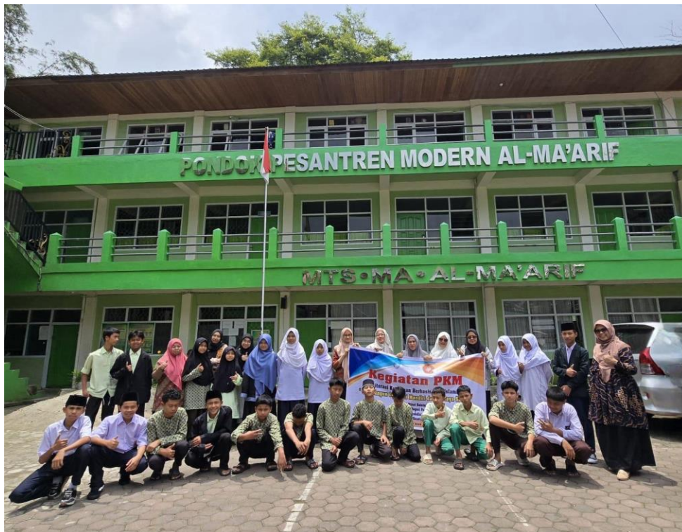
Gambar 7. Foto Bersama Tim Pengabdian Kepada Masyarakat, Guru dan Peserta