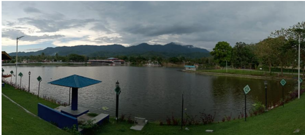
Gambar 2. Kondisi Kawasan Danau Perintis

Kondisi perairan dan bentang alam kawasan turut memengaruhi pola aktivitas masyarakat. Danau dimanfaatkan untuk irigasi, perikanan, rekreasi, dan kegiatan ekonomi pendukung wisata. Pemanfaatan tersebut memperlihatkan bahwa ruang danau tidak hanya memiliki nilai ekologis, tetapi juga nilai sosial-ekonomi. Interaksi ini memperkuat makna toponimi karena nama Danau Perintis tidak dapat dilepaskan dari fungsi ruang yang terus berkembang.