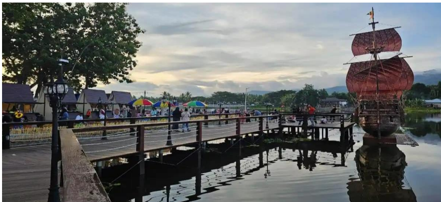
Gambar 3. Aktivitas Wisata dan Masyarakat di Danau Perintis

Partisipasi masyarakat merupakan kunci dalam pariwisata berkelanjutan. Hasil wawancara menunjukkan bahwa masyarakat sekitar telah terlibat dalam aktivitas wisata, seperti berdagang, menyediakan jasa bagi pengunjung, dan ikut menjaga kawasan. Namun, partisipasi tersebut masih perlu diperkuat melalui pelatihan, pembagian peran, dan pengembangan produk wisata berbasis cerita lokal. Kajian ecotourism di Gorontalo juga menekankan pentingnya keterlibatan masyarakat, potensi alam, dan kelembagaan lokal dalam pengembangan destinasi yang berkelanjutan (Eraku et al., 2021; Eraku et al., 2023a; Eraku et al., 2023b).