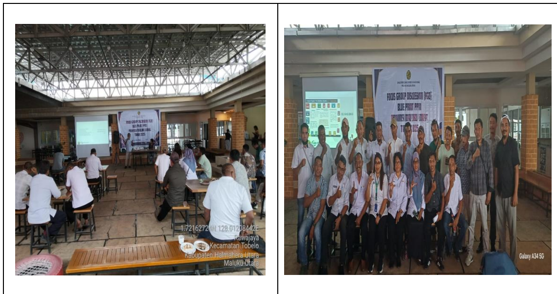
Gambar 3. Pelaksanaan kegiatan FGD

Kegiatan dilanjutkan dengan Focus Group Discussion (FGD) yang melibatkan pihak desa, kecamatan, beberapa dinas terkait dan tim CSR PT Nusa Halmahera Minerals (NHM). Hasil FGD menunjukkan adanya kesamaan persepsi bahwa program PPM memiliki peran strategis dalam meningkatkan kesejahteraan masyarakat, namun implementasinya masih memerlukan peningkatan dalam aspek sosialisasi, koordinasi, dan pelibatan masyarakat (Gambar 3).