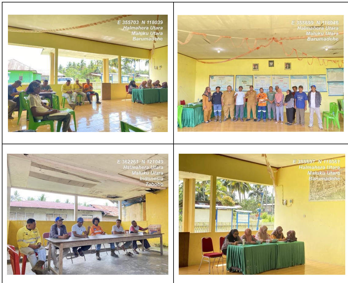
Gambar 1. Pelaksanaan kegiatan sosialisasi PPM di Desa Barumadehe dan Tabobo

Berdasarkan hasil evaluasi yang dilakukan setelah kegiatan sosialisasi, diperoleh gambaran tingkat pemahaman masyarakat terhadap program PPM sebagai berikut: 12% masyarakat berada pada kategori paham, 47% cukup paham, 39% kurang paham, dan 2% tidak paham (gambar 2). Hasil ini menunjukkan bahwa mayoritas masyarakat berada pada kategori cukup paham, namun masih terdapat proporsi yang cukup besar pada kategori kurang paham.