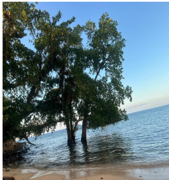
Pantai Tanjung Manis