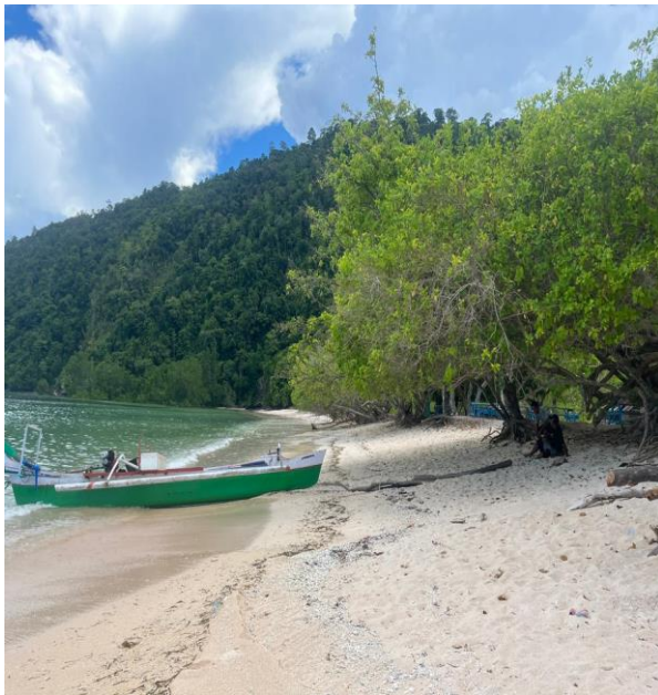
Pantai Tanjung Dako