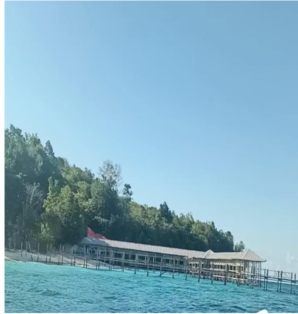
Pantai Pulau Busak