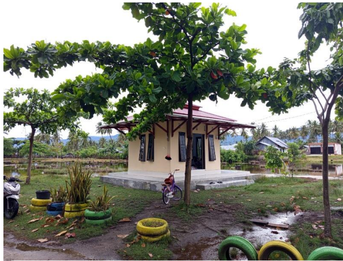
Gambar 9. Mushola

wisatawan dapat berjalan lebih baik dan memberikan kenyamanan yang maksimal bagi pengunjung. Kondisi mushola disajikan pada Gambar 10.