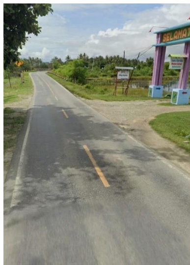
Gambar 4. Kondisi Jalan Menuju Wisata

Pantai Muara Indah memiliki aksesibilitas yang cukup baik karena dapat dijangkau melalui transportasi darat dengan kondisi jalan yang pada umumnya telah beraspal, sehingga memudahkan wisatawan untuk mencapai lokasi wisata dari berbagai wilayah di sekitarnya. Kemudahan akses tersebut menjadi salah satu faktor pendukung dalam pengembangan kawasan wisata karena dapat meningkatkan kenyamanan dan minat kunjungan wisatawan. Di sisi lain, keberadaan panorama pantai yang masih alami, pemandangan pesisir yang menarik, serta lingkungan yang relatif terjaga memberikan nilai tambah bagi daya tarik wisata yang dimiliki. Berbagai potensi alam tersebut menjadikan Pantai Muara Indah memiliki prospek yang cukup besar untuk dikembangkan sebagai destinasi wisata bahari yang lebih maju, kompetitif, dan mampu memberikan kontribusi terhadap peningkatan aktivitas ekonomi masyarakat serta pengembangan sektor pariwisata daerah. Kondisi jalan menuju wisata disajikan pada Gambar 4.