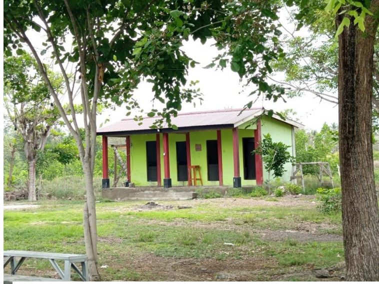
Gambar 10. Toilet Umum

pengunjung meningkat, terutama pada hari libur, akhir pekan, dan musim wisata. Kondisi toilet umum disajikan pada Gambar 11.