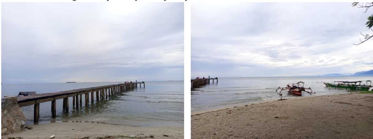
Gambar 7. Dermaga dan Kapal Nelayan

Dermaga sandaran kapal nelayan menjadi salah satu fasilitas penting yang mendukung aktivitas ekonomi masyarakat pesisir, khususnya bagi nelayan yang menggantungkan mata pencaharian dari hasil laut. Kondisi dermaga dan kapal nelayan disajikan pada Gambar 7.