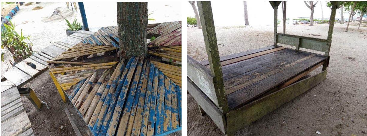
Gambar 6. Fasilitas yang mengalami kerusakan

Namun demikian, hasil penelitian menunjukkan bahwa beberapa gazebo yang tersedia di kawasan Pantai Muara Indah mulai mengalami penurunan kualitas akibat pengaruh kondisi cuaca pesisir dan kurangnya perawatan secara rutin. Paparan panas matahari, air hujan, serta udara laut yang lembap menyebabkan beberapa bagian gazebo mengalami kerusakan. Kondisi atap yang mulai rusak, kayu bangunan yang lapuk, serta beberapa bagian gazebo yang terlihat kurang terawat menyebabkan tingkat kenyamanan wisatawan menjadi berkurang. Selain itu, jumlah gazebo yang tersedia masih dinilai belum mencukupi untuk menampung jumlah pengunjung yang datang, terutama ketika terjadi peningkatan jumlah wisatawan pada akhir pekan, hari libur, maupun musim liburan. Kondisi fasilitas yang mengalami kerusakan Disajikan pada Gambar 6.