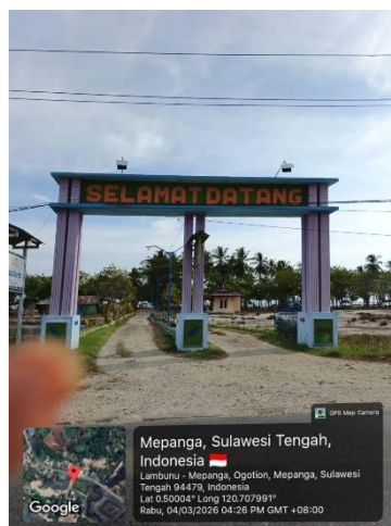
Gambar 2. Wisata Pantai Muara Indah

Pantai Muara Indah terletak di Desa Ogotion, Kecamatan Mepanga, Kabupaten Parigi Moutong, Provinsi Sulawesi Tengah. Kawasan pantai ini berada di pesisir Teluk Tomini dan memiliki potensi wisata alam yang cukup besar. Pantai Muara Indah dikenal karena suasana pantainya yang masih alami, kondisi perairan yang tenang, serta pemandangan pesisir yang menarik bagi wisatawan. Wisata Pantai Muara Indah disajikan pada Gambar 2.