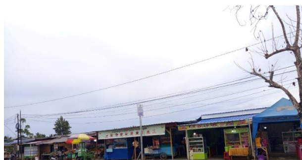
Gambar 8. UMKM Lokal

Aktivitas perdagangan yang berlangsung di area wisata mampu menciptakan peluang usaha dan meningkatkan pendapatan masyarakat lokal, khususnya bagi pelaku usaha kecil dan keluarga yang menggantungkan penghasilan dari sektor pariwisata. Kehadiran wisatawan yang membeli makanan dan minuman turut membantu meningkatkan perputaran ekonomi masyarakat setempat sehingga sektor