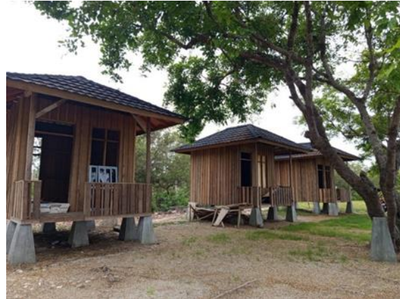
Gambar 9. Villa