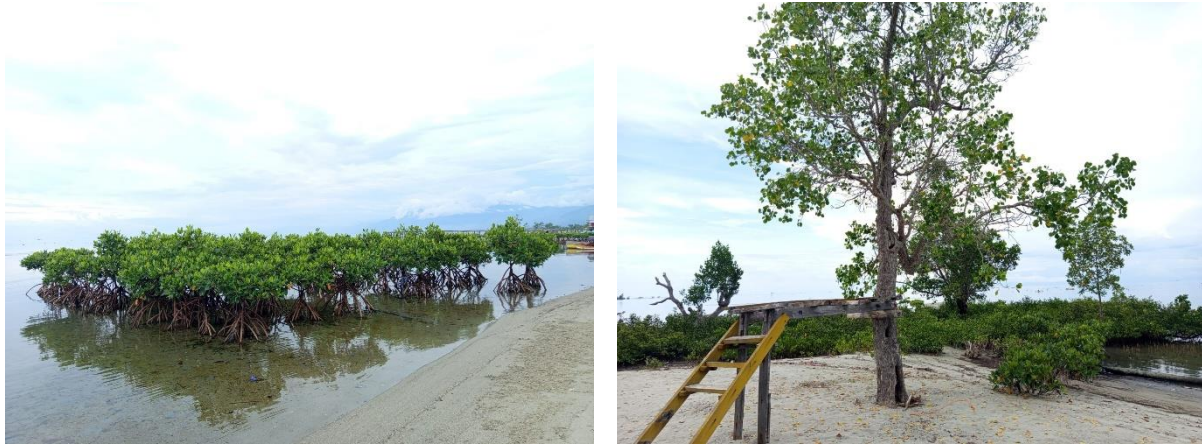
Gambar 3. Ekosistem Mangrove

Ekosistem mangrove yang terdapat di Pantai Muara Indah tidak hanya memberikan manfaat dari aspek lingkungan, tetapi juga memiliki nilai sosial dan ekonomi bagi masyarakat pesisir yang menggantungkan sebagian aktivitasnya pada sumber daya alam laut. Ekosistem mangrove disajikan pada Gambar 3.