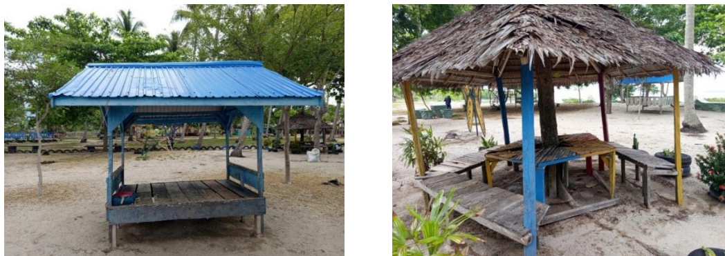
Gambar 5. Fasilitas Gazebo

Gazebo merupakan salah satu fasilitas pendukung wisata yang memiliki peranan penting dalam memberikan kenyamanan bagi pengunjung di kawasan Pantai Muara Indah. Fasilitas ini banyak dimanfaatkan wisatawan sebagai tempat untuk beristirahat setelah melakukan berbagai aktivitas wisata di area pantai. Keberadaan gazebo memberikan suasana yang lebih nyaman karena wisatawan dapat duduk santai sambil menikmati keindahan panorama laut, hembusan angin pantai, serta suasana alam pesisir yang masih alami. Kondisi fasilitas gazebo disajikan pada Gambar 5.