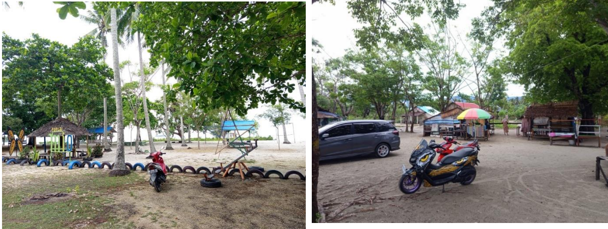
Gambar 11. Lahan Parkir Sederhana

Saat musim hujan, kondisi tanah di area parkir sering menjadi becek dan berlumpur sehingga menyulitkan kendaraan untuk keluar masuk kawasan wisata. Selain itu, belum tersedianya marka parkir, rambu petunjuk, dan pembatas area kendaraan menyebabkan kendaraan pengunjung diparkir secara tidak teratur. Kondisi tersebut tidak hanya mengurangi kenyamanan wisatawan, tetapi juga mempengaruhi estetika dan kerapian kawasan wisata secara keseluruhan. Keterbatasan fasilitas pendukung di area parkir juga menjadi salah satu kendala dalam pengelolaan kawasan wisata Pantai Muara Indah. Hingga saat ini, area parkir belum dilengkapi dengan fasilitas seperti tempat berteduh, penerangan yang memadai, pos keamanan, maupun petugas parkir yang dapat membantu mengatur kendaraan pengunjung.