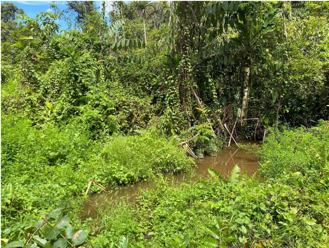
Gambar 3. Kenampakan Subsatuan Dataran Rawa