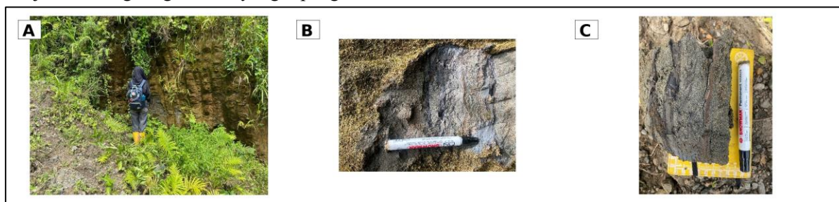
Gambar 6. Kenampakan singkapan batupasir perlapisan batulempung

Kehadiran batupasir menunjukkan adanya perubahan energi pengendapan dibandingkan batulempung. Batupasir umumnya terbentuk pada kondisi arus yang lebih kuat sehingga mampu mengangkut dan mengendapkan material berukuran pasir. Hubungan batupasir dengan batulempung menunjukkan adanya fluktuasi energi pengendapan, yang dapat terjadi pada sistem sungai, dataran banjir, atau lingkungan rawa yang dipengaruhi aliran fluvial.