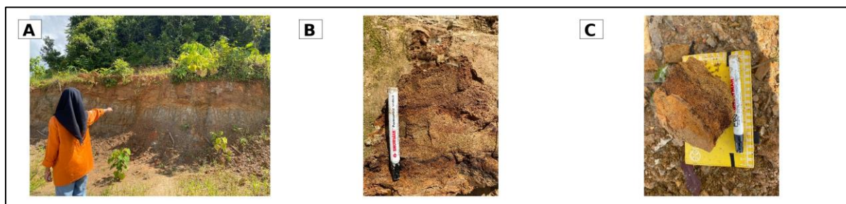
Gambar 7. Kenampakan singkapan dan sampel Satuan Batupasir Sele

Pada singkapan lain, batupasir tampak mengalami pelapukan dengan warna kecoklatan pada bagian luar. Kondisi ini memperlihatkan bahwa batuan sedimen di daerah penelitian telah mengalami proses pelapukan tropis yang cukup kuat. Pelapukan tersebut menghasilkan material lepas dan dapat berkontribusi terhadap pembentukan endapan permukaan.