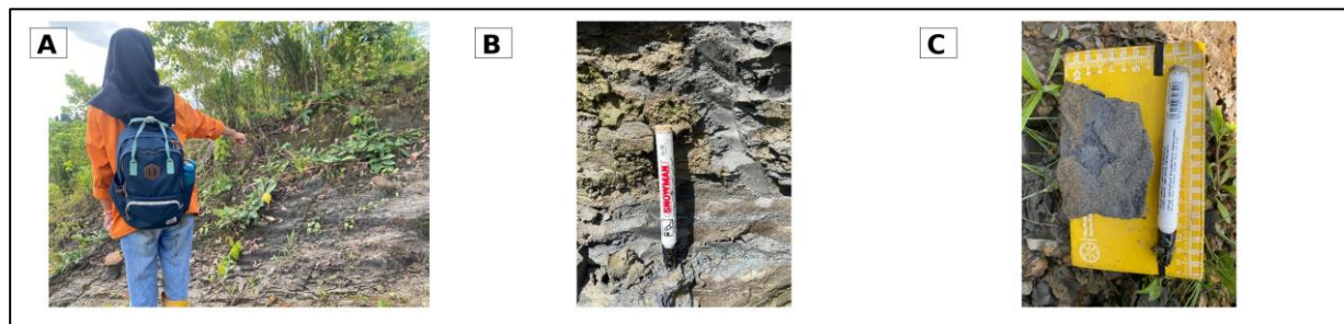
Gambar 5. Kenampakan singkapan dan sampel Satuan Batulempung Sele

Keberadaan batulempung menunjukkan lingkungan pengendapan berenergi rendah. Material lempung umumnya terendapkan pada lingkungan tenang, seperti rawa, dataran banjir, atau cekungan kecil yang tidak banyak dipengaruhi arus kuat. Kondisi ini sejalan dengan geomorfologi daerah penelitian yang memperlihatkan satuan dataran rawa dan relief rendah. Weller, J. M. (1960).