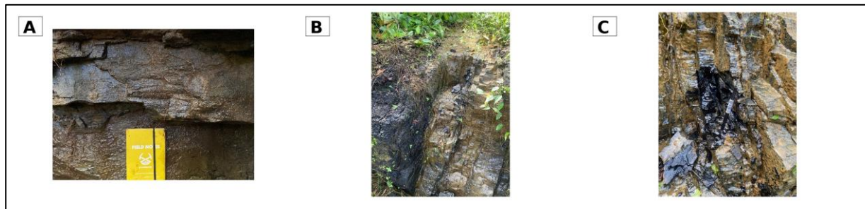
Gambar 8. Kenampakan batubara pada daerah penelitian

Dalam kajian geologi daerah, kemunculan batubara menjadi indikator penting untuk memahami lingkungan pengendapan. Kehadiran batubara bersama batulempung dan batupasir menunjukkan adanya perubahan lingkungan dari kondisi rawa tenang ke kondisi yang dipengaruhi suplai sedimen klastik. Oleh karena itu, batubara di daerah Klasari dapat dipahami sebagai bagian dari sistem sedimen Formasi Sele yang berkembang pada lingkungan daratan hingga rawa.