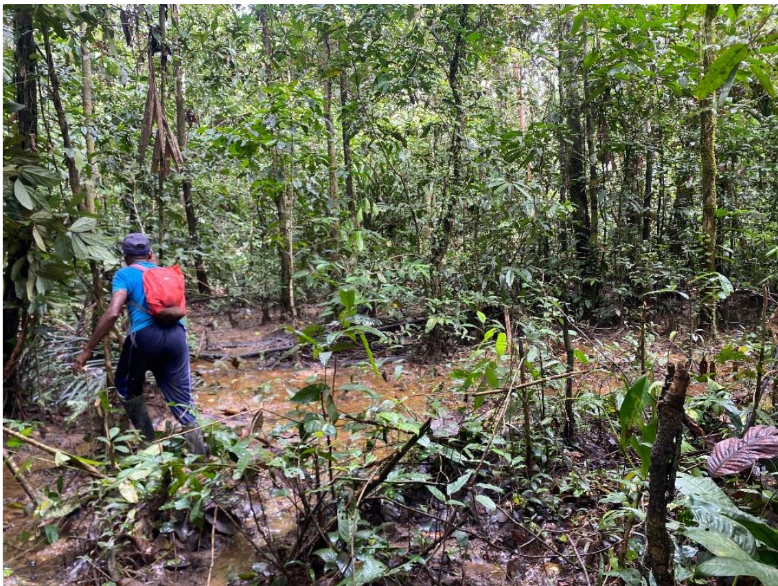
Gambar 9. Kenampakan material sedimen pada Endapan Aluvial

Secara geologi, endapan aluvial menunjukkan proses sedimentasi yang masih berlangsung hingga saat ini. Material yang terangkut oleh air akan diendapkan pada daerah yang lebih rendah atau pada bagian dengan energi aliran yang menurun. Keberadaan endapan aluvial yang cukup luas mendukung interpretasi bahwa daerah penelitian memiliki relief rendah dan proses fluvial yang aktif.