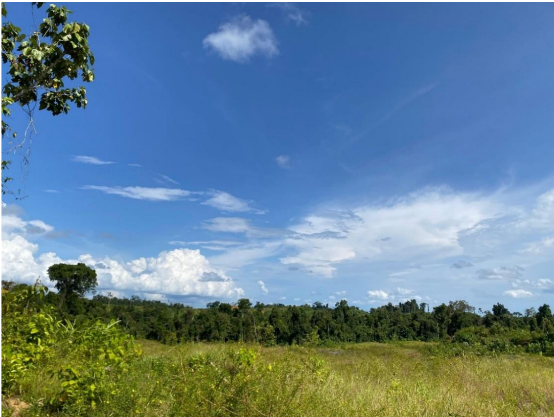
Gambar 2. Kenampakan Satuan Dataran Rendah Datar

Ciri utama satuan ini adalah permukaan relatif datar sampai bergelombang sangat lemah. Pada kondisi seperti ini, aliran permukaan cenderung lambat, sehingga material halus lebih mudah terendapkan. Kondisi tersebut sesuai dengan keberadaan litologi sedimen seperti batulempung dan batupasir yang memiliki hubungan erat dengan lingkungan pengendapan daratan sampai rawa. 4