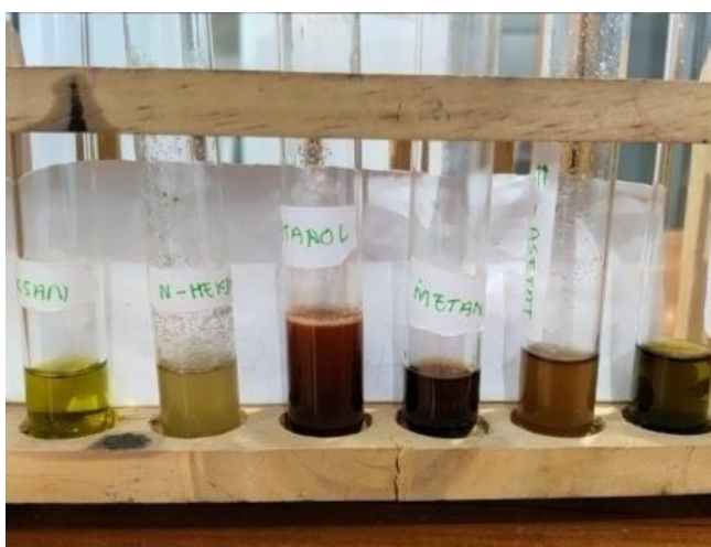
Gambar 1. Hasil skrining fitokimia daun sambang darah

Hasil uji skrining senyawa flavanoid ekstrak kental daun sambang darah ( Excoecaria Cochinchinensis L) terjadi perubahan warna pada ekstrak kental methanol dari yang semula coklat menjadi merah yang menandakan positif flavanoid, sedangkan untuk ekstrak kental n-heksan dan etil asetat tidak terjadi perubahan warna yang menandakan positif flavanoid, hal ini bias dilihat pada tabel 2. Setelah didapati ekstrak kental dari masing-masing pelarut yang diinginkan kemudian dilakukan uji warna flavanoid dengan melarutkan sampel dengan methanol kemudian ditambahkan beberapa tetes HCl dan serbuk magnesium, dari ketiga ekstrak kental tersebut didapati bahwa hanya ekstrak kental dari pelarut methanol yang positif mengandung flavonoid karena terjadi perubahan warna menjadi merah, hal ini sesuai dengan skrining fitokimia yang dilakukan oleh Oktariza dimana sampel berubah menjadi merah setelah penambahan beberapa tetes HCl dan serbuk magnesium [10].