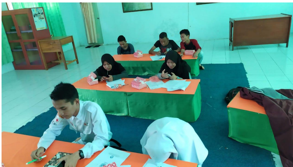
Gambar 3. Penerimaan materi oleh peserta

Setelah siswa menentukan topik yang sesuai, selanjutnya diberikan materi tentang pemilihan media foto yang sesuai dengan topik yang telah dipilih. Pada kegiatan ini, siswa memseleksi dengan hati-hati, foto yang diberikan, mereka memilih dengan mudah dan tentu saja dengan interaktif. Pelibatan siswa dalam pembelajaran sangat penting untuk mendapatkan pengalaman belajar yang bermakna (Pyry, 2016). Walaupun demikian masih ada 3 orang siswa yang kesulitan dalam memilih media foto yang sesuai dengan topik yang mereka pilih sendiri, suasana penerimaan materi oleh peserta pada gambar 3.