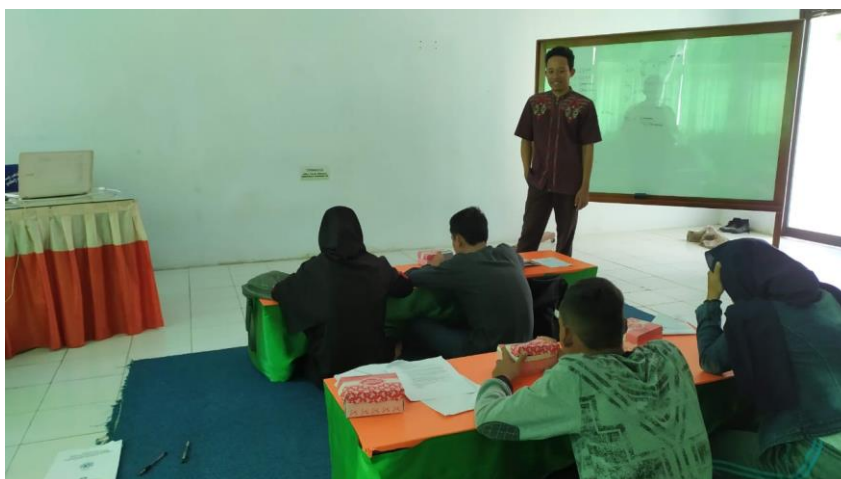
Gambar 1. Pelaksanaan Pemberian Materi dan pendampingan Diseminasi

Pada tahapan pelaksanaan, Siswa diberikan materi tentang penentuan topik, pada materi ini di berikan pengetahuan tentang topik yang sesuai dengan karakteristik foto yang diberikan. Siswa tidak kesulitan dalam menentukan topik karena media foto yang diberikan adalah tempat yang tidng asing dengan mereka. Media yang menarik dapat memebuat siswa lebih interaktif dalam pembelajaran (Surahmi et al., 2021). Suasana pelaksanaan pemberian materi dan pendampingan diseminasi pada gambar 1.