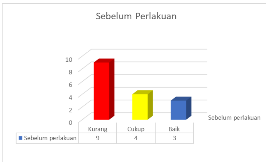
Gambar 4. Hasil Evaluasi Pre Test Sebelum Pemberian Materi Diseminasi

Pada tahapan evaluasi post test diperoleh hasil evaluasi bahwa semua siswa yang telah mengikuti materi diseminasi penggunaan media telah memahami dengan baik yaitu 100% siswa dalam kategori baik. Mereka berpendapat bahwa, pemahaman ini diperoleh karena ada pendampingan setelah diberikan materi sehingga memudahkan dalam memahami materi yang diberikan. Hasil pre test pada gambar 5.