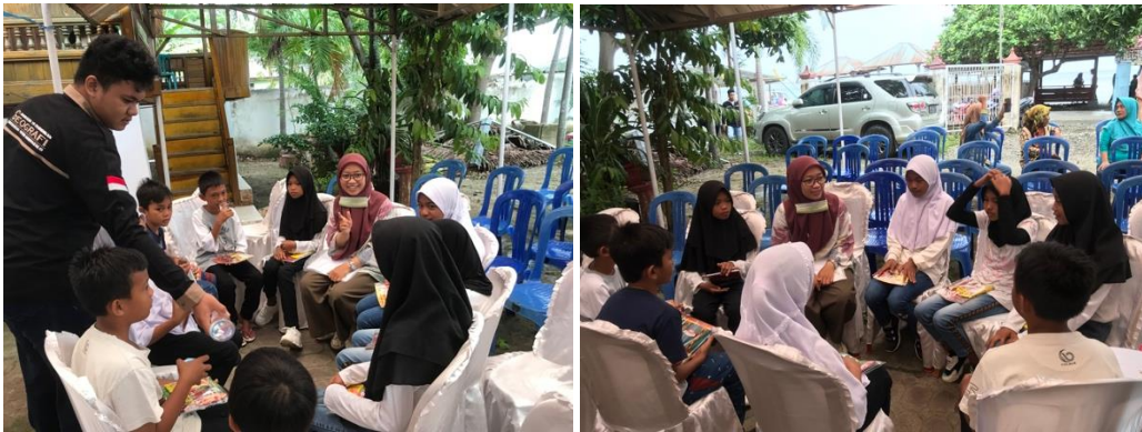
Gambar 2. Pelaksanaan Pemberian Materi Dan Pendampingan

Pada tahap pelaksanaan peserta didik mendengarkan penjelasan dan mengamati gambar yang sudah dibagikan, setelah itu peserta didik memberikan pendapat sesuai dengan gambar yang dilihat. Dengan disajikan gambar-gambar mengenai kerusakan dan dampaknya bagi lingkungan membuat peserta didik antusias untuk bertanya mengenai Tindakan apa yang harus dilakukan jika hal tersebut terjadi di desa mereka. Pada tahap ini perlu diketahui bahwa untuk membangun kesadaran peduli lingkungan yaitu harus dimulai dari hal kecil, dimulai dari diri sendiri dan memulai dari sekarang. Dengan membiasakan diri melakukan hal-hal tersebut diharapkan rasa peduli lingkungan dapat terbentuk dan menjadi kebiasaan untuk menjaga lingkungan kita jadi bersih dan nyaman untuk ditinggali.