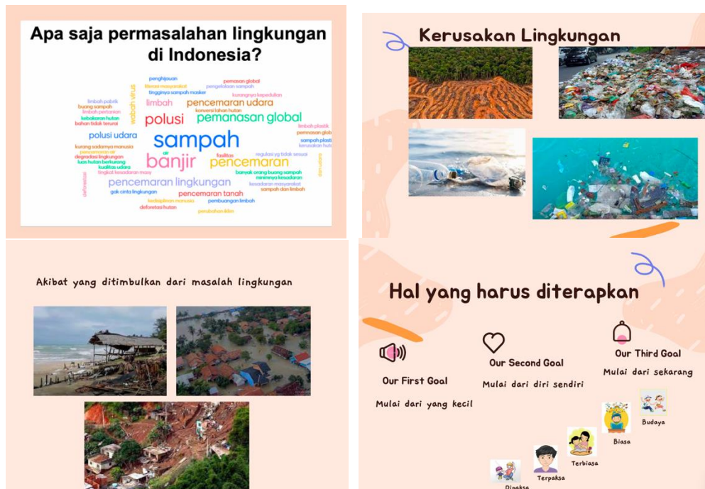
Gambar 1. Materi Yang Disampaikan Pada Kegiatan Pengabdian

Pada tahap selanjutnya pelaksanaan dilakukan observasi dengan pendampingan untuk memberikan materi mengenai Pendidikan karakter dan kearifan lokal. Melakukan tanya jawab untuk mengetahui sejauh mana pengetahuan peserta didik SD 03 Kabila Bone mengenai salah satu karakter yang diajarkan di sekolah. Peserta yang terlibat yaitu 18 orang terdiri dari kelas 4,5 dan 6. dalam pelaksanaan peserta didik diberikan pertanyaan mengenai permasalahan lingkungan yang ada di Indonesia, dampak yang terjadi dari kerusakan lingkungan dan apa yang harus dilakukan untuk mencegahnya.