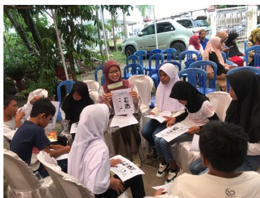
Gambar 3. Evaluasi Mengenai Materi Penguatan Pendidikan Karakter

Pada kegiatan ini peserta didik diberikan pengetahuan mengenai hal-hal yang merusak lingkungan terlebih dahulu. Seperti membuang sampah sembarangan yang akan membuat lingkungan kotor dan banjir. Memberikan contoh jika hal terkecil yaitu dengan membuang sampah sembarangan maka akan mengakibatkan lingkungan sendiri kotor dan bau. Baik itu di sekolah dan di rumah peserta didik diajak untuk tidak melakukan membuang sampah sembarangan dengan mencontohkan akibat dari membuang sampah sembarangan disungai maka akan menyebabkan banjir. Setelah memberikan contoh dan sosialisasi kepada peserta maka diberikan penguatan dengan Tindakan nyata yaitu dengan mereka memilah sampah organik dan anorganik. Sampah yang dapat terdaur dengan sendirinya di alam dan sampah yang membutuhkan waktu lama atau tidak bisa terdaur ulang di alam. Karena wilayah desa molotabu di wilayah pesisir maka peserta didik diajak untuk melestarikan lingkungan wilayah mereka dengan tetap menjaga kelestarian dan kearifan lokal yang ada di daerahnya. Dengan menjaga kearifan lokal diharapkan dapat membentuk kepedulian untuk tidak membuat kerusakan alam yang akan menjadi kerugian buat penduduk setempat.