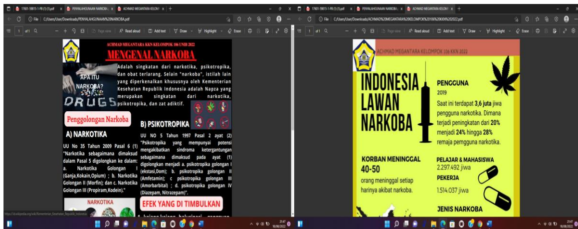
Gambar 3. Pamplet Tentang Bahaya Narkoba