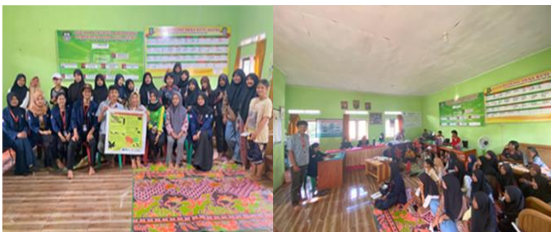
Gambar 4. Sosialisasi Tentang Bahaya Narkoba

Pelaksanaan kegiatan sosialisasi bahaya narkoba ini di lakukan secara offline (langsung) di karenakan para peserta berkesempatan hadir yang di mana pada saat itu berkenaan juga dengan adanya program posyandu remaja yang rutin dilakukan oleh bidan desa. Berdasarkan jumlah orang yang berkesempatan untuk hadir setidaknya adalah 25 orang remaja, 6 orang dewasa yang tiga di antaranya adalah Ibu PJS Kepala Desa Kuti Agung beserta jajarannya. Kegiatan sosialisasi di tutup dengan penyerahan pamflet yang sebelumnya telah di cetak kepada Desa Kuti Agung yang di wakili oleh Ibu PJS Kepala Desa Kuti Agung.