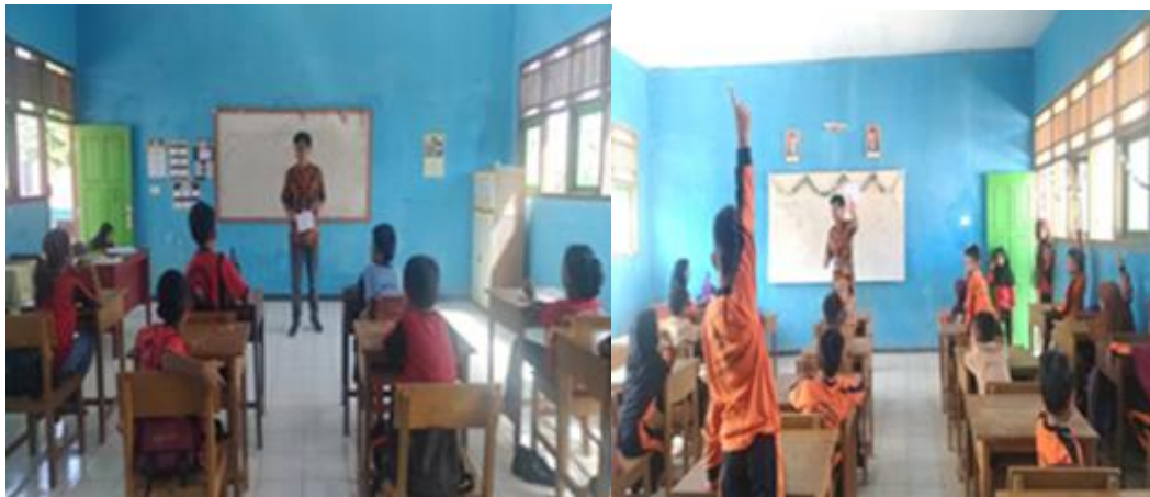
Gambar 5. Pelaksanaan Lomba Penanaman Nilai-nilai Pancasila

Pada kegiatan ini tidak semua kelas menjadi sasaran pelaksanaan kegiatan. Yang menjadi sasaran kegiatan hanyalah kelas dua dan empat pada SDN 106 Di Desa Kuti Agung. Kegiatan dilaksanakan pada tanggal 23 Juli 2022 bertepatan dengan hari anak nasional. Peserta kegiatan ini pada kelas dua hanya 18 orang dan pada kelas empat hanya 20 orang.