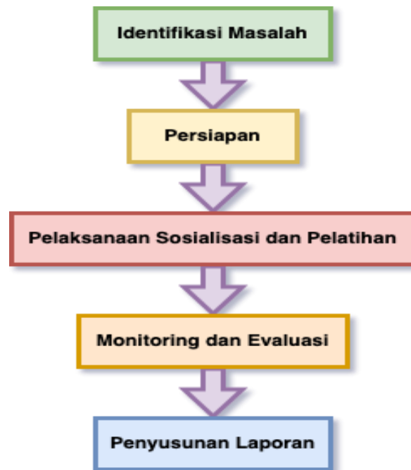
Gambar 1. Alur Pelaksanaan Pengabdian

Pada tahap identifikasi masalah penulis merumuskan permasalahan yang terjadi yaitu permasalahan tim pokja dalam menyusun dan menata dokumen akreditasi dengan baik serta pencarian dokumen yang masih sangat lama karena mencari dokumen masih secara manual serta terkadang ada softcopy dokumen yang hilang dikarenakan data penyimpanan pokja terkena virus. Pada tahap Persiapan, Penulis sebelumnya sudah mengikuti pelatihan yang langsung dilakukan oleh KARS sendiri. Kemudian menyampaikannya kepada para ketua pokja dirumah sakit tentang penggunaan aplikasi SIDOKAR ini.