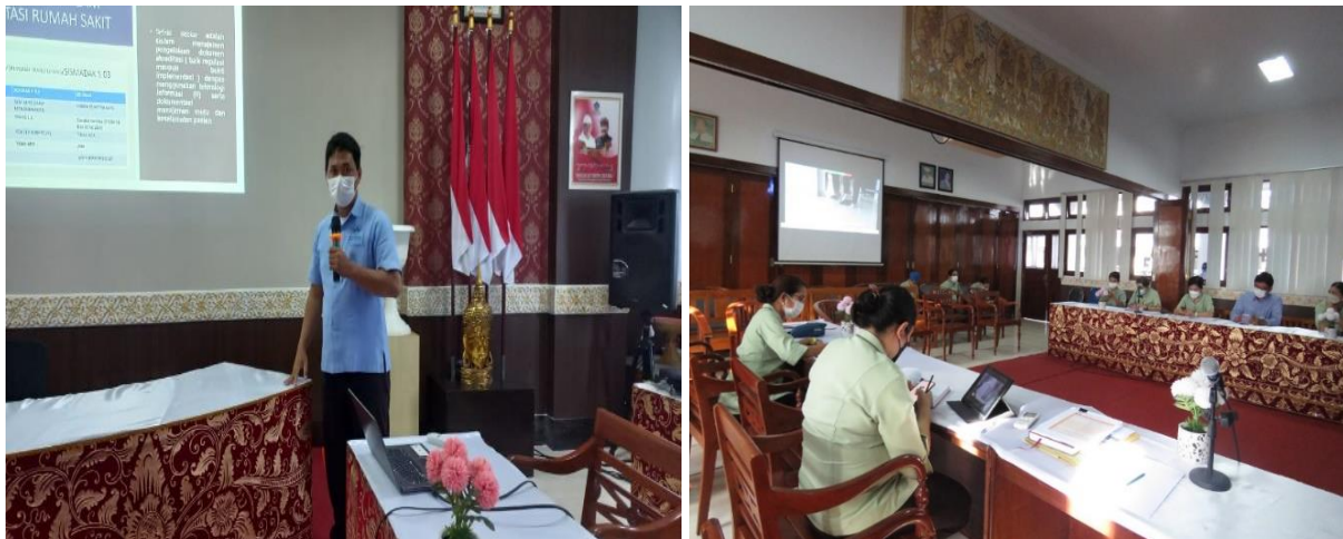
Gambar 2. Pemberian Materi Tentang Penggunaan Aplikasi SIDOKAR

lingkungan Rumah Sakit Umum Puri Raharja. Kegiatan ini dilaksanakan pada tanggal 8 September 2022 bertempat di Aula Perteman lantai IV Rumah Sakit Umum Puri Raharja Denpasar. Materi yang diberikan selama pelatihan menyangkut tentang aplikasi SIDOKAR. Dibahas mengenai peran SIDOKAR dalam akreditasi rumah sakit, perbedaan fitur SISMADAK dan SIDOKAR, perbedaan tampilan SISMADAK dan SIDOKAR, perbedaan self asesmen antara SISMADAK dan SIDOKAR, penjelasan alasan penggunaan teknologi informasi, penjelasan fungsi SIDOKAR, kebutuhan peralatan jaringan dan server SIDOKAR, dukungan teknologi informasi KARS, manfaat SIDOKAR bagi Rumah Sakit, manfaat SIDOKAR bagi KARS, peran stakeholder dalam SIDOKAR, pengoperasian SIDOKAR, pengisian instrument pada SIDOKAR, hingga pelatihan dalam penggunaan SIDOKAR.